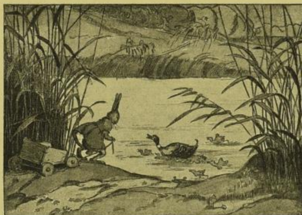
Illustrationsprobe. Original farbig.

Die farbigen Bilder von Luise Rumpa stehen in vollem Einklang mit den Märchen; sie sind ebenso reizend ausgeführt wie die Märchen erzählt sind.