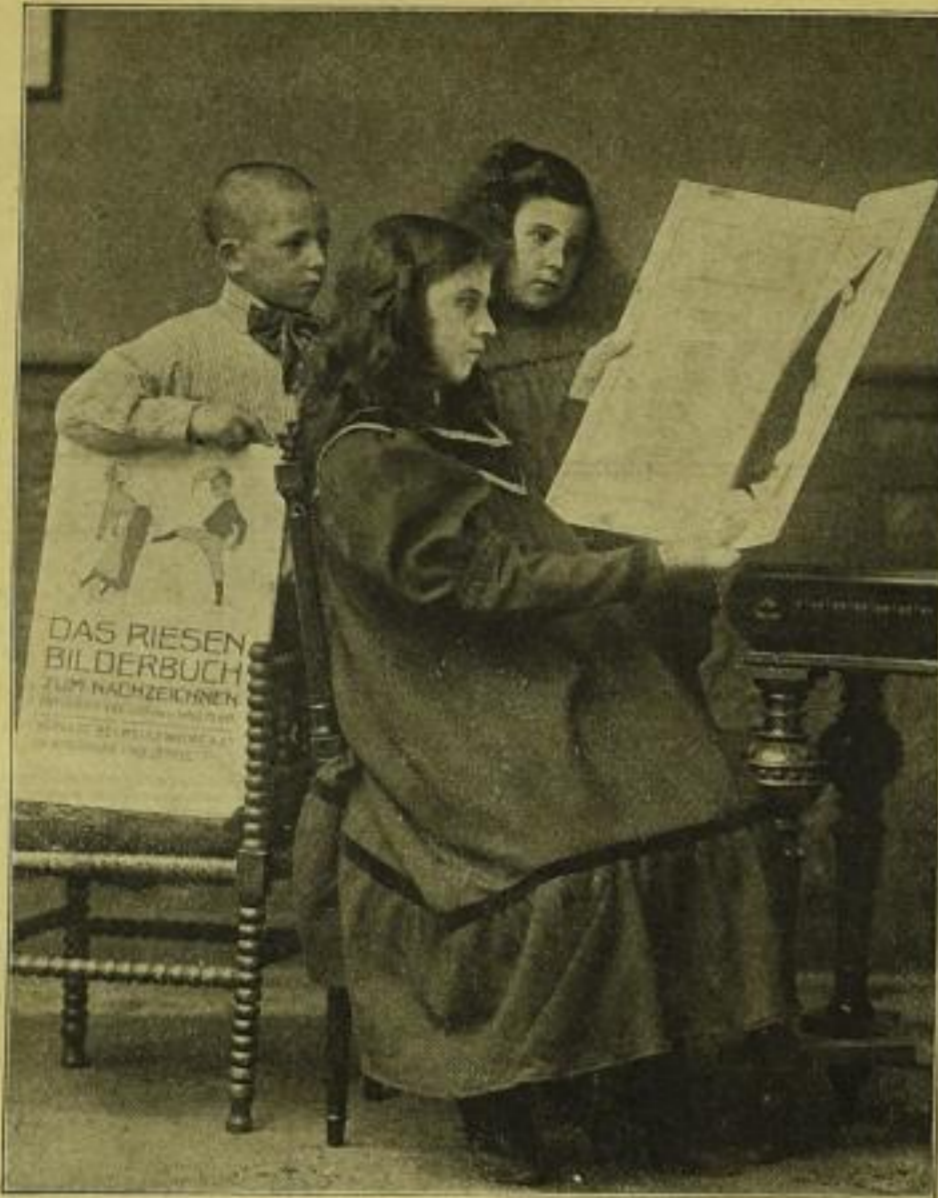
Photographische Aufnahme des Riesenbilderbuches. Das Riesenbilderbuch zum Lachen und zum Lesen bietet drei Kindern zugleichzeit die Gelegenheit sich zu unterhalten. Links auf dem Stuhle das Riesenbilderbuch zum Nachzeichnen.

vorgeführt werden und direkt zum kindlichen Gemüte reden. Die streitenden Hühner, der Affe, der fröhliche Schmetterlingsfänger und die anderen urkomischen Darstellungen sieht man alle wie lebend, naturgetreu vor sich.