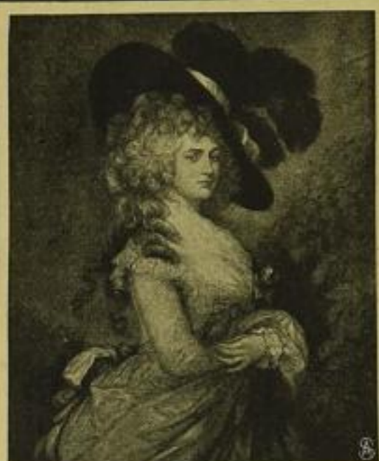
Herzogin von Devonshire. Privatbesitz, London.

Zur Lagerergänzung empfehlen wir die farbigen Kupferdrucke (Faksimile-Gravüren) nach den Originalen von