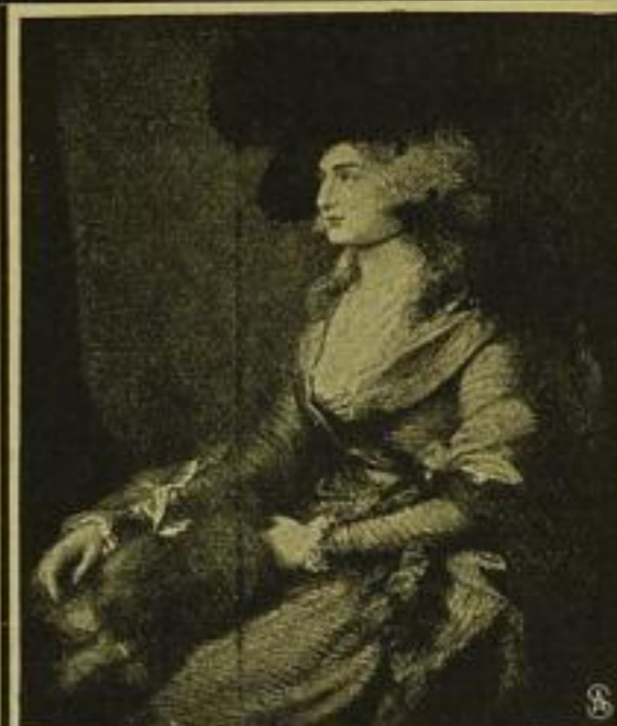
Mrs. Siddons. National Gallery, London.

rühmten Malers englischer Frauenschönheiten zählen. Unsere farbigen Handpressendrucke geben den koloristischen Reiz der Gemälde in technisch vollendeter Weise wieder. Durch Ausstellen und Vorlegen ist überall Absatz zu erzielen. Wir bitten zu verlangen.