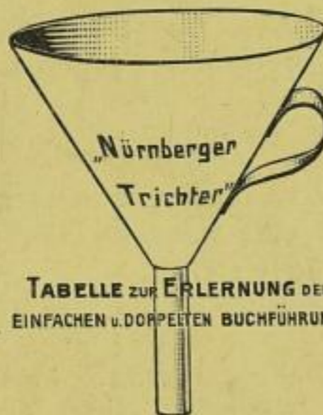
TABELLE ZUR ERLERNUNG DER EINFACHEN u. DOPPELTEN BUCHFÜHRUNG.