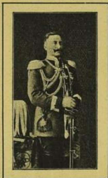
1038. Kaiser Wilhelm II. Folio-Bromsilberdruck M. 1.— ord., M. —.60 no. In Eichenmotivrahmen mit Krone No. 5230 M. 5.— ord., M. 3.— no.