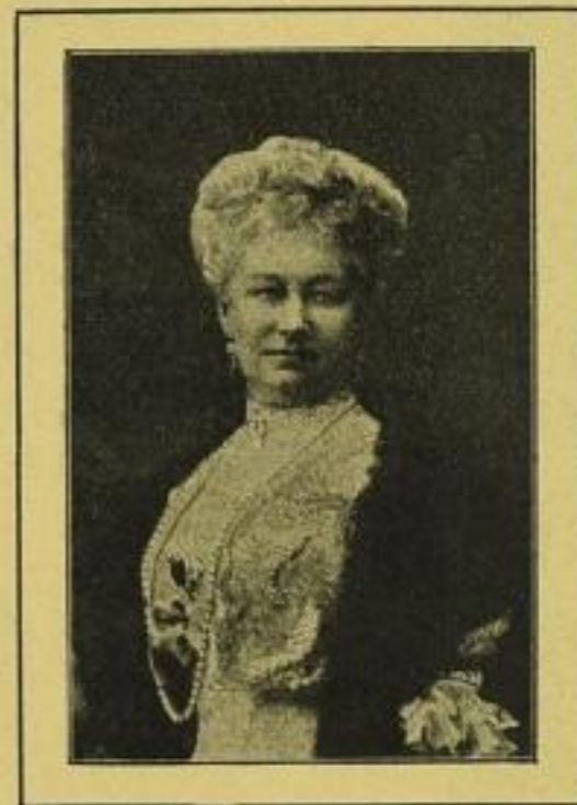
1041. Kaiserin Auguste Viktoria.

Unser soeben erschienener Verlagskatalog kostet M. —.50. Unser soeben erschienener Katalog gerahmter Bilder kostet M. —.75. Bei Bestellungen über M. 20.— erfolgt Gutschrift! Verlangzettel anbei!