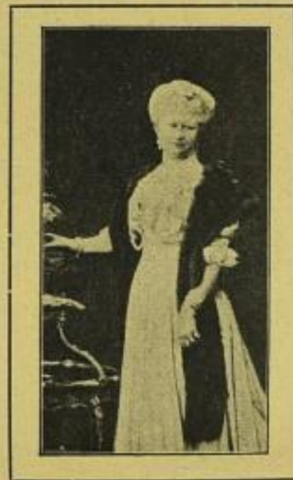
1039. Kaiserin Auguste Viktoria Folio-Bromsilberdruck M. 1.— ord., M. —.60 no. In Eichenmotivrahmen mit Krone No. 5230 M. 5.— ord., M. 3.— no.