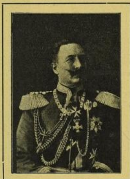
1040. Kaiser Wilhelm II.