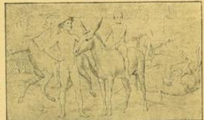
Nr. 154. Eselwiese.

Kunstverlagskatalog gratis. Zettel liegt No. 231 bei.