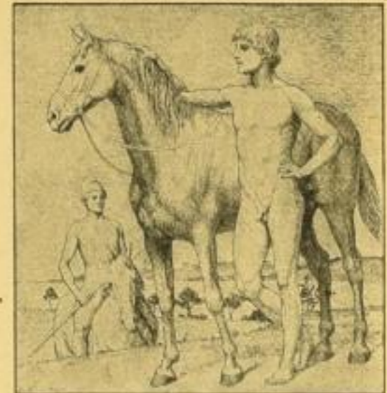
Nr. 153. Jüngling mit Pferd.

Handlungen mit etwas Sinn für Humor werden durch andauerndes Vorlegen der prächtigen, künstlerisch lauterer Blätter bei der Kundschaft die rechte Antwort auf das groteske Vorkommnis, das durch alle Zeitungen geht, zu finden wissen!