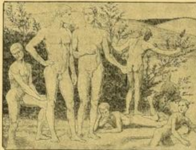
Nr. 151. Tiberbad.

Handlungen mit etwas Sinn für Humor werden durch andauerndes Vorlegen der prächtigen, künstlerisch lauterer Blätter bei der Kundschaft die rechte Antwort auf das groteske Vorkommnis, das durch alle Zeitungen geht, zu finden wissen!