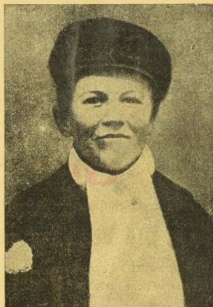
Als Zeitungsjunge von 13 Jahren.