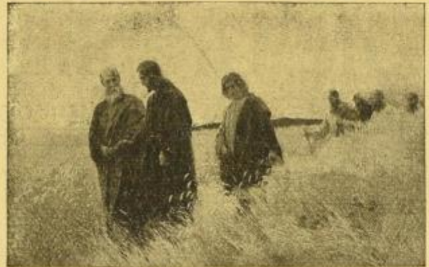
No. 137. J. R. WEHLE: Und sie folgten ihm nach. Bild 46×74 cm, Karton 72×98 cm. M. 25.— ord. „ 34×51½ „ „ 55×72 „ „ 12.50 „ „ 20×31½ „ „ 40×51 „ „ 6.25 „