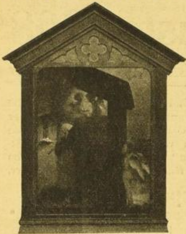
No. 81. A. BÖCKLIN: Der Eremit. Nach dem Original in der Kgl. National- Galerie, Berlin. Bild 48×63 cm Karton 77×95 cm M. 25.— ord. Im abgebildeten Altgoldrahmen 78×99 cm M. 55.— ord.