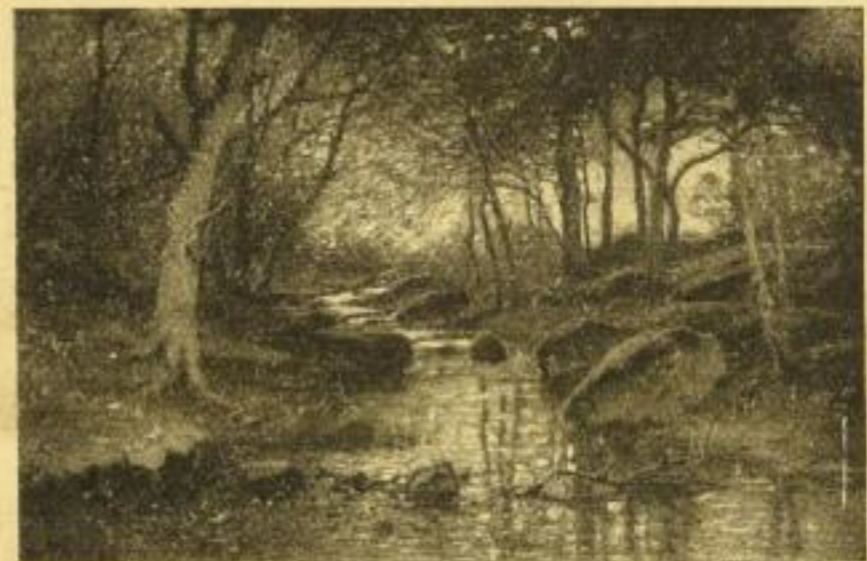
No. 113. MÜLLER-KURZWELLY: Herbstgold (Ilsetal). Bild 47×72 cm, Karton 77×95 cm. M. 25.— ord. „ 33½×51 „ „ 57×75 „ „ 12.50 „

Studie zum Original in der Kgl. National-Galerie Berlin.