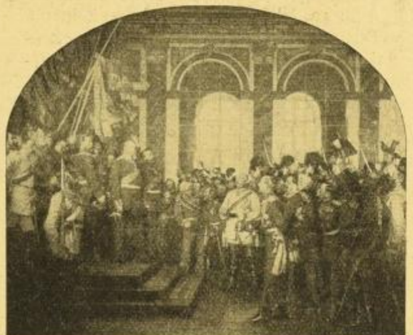
No. 127. A. v. WERNER: Kaiserproklamation in Versailles. Bild 59×71 cm, Karton 77×98 cm. M. 25.— ord. Prachtausgabe: Bild 78×94 cm, Karton 108×129 cm. M. 50.— ord.

Als Gegenstück zu No. 127 erschienen folgende Ruhmes- hallenbilder: Freiwillige von 1813 Leipzig Belle-Alliance Königgrätz St. Privat je M. 25.— ord.