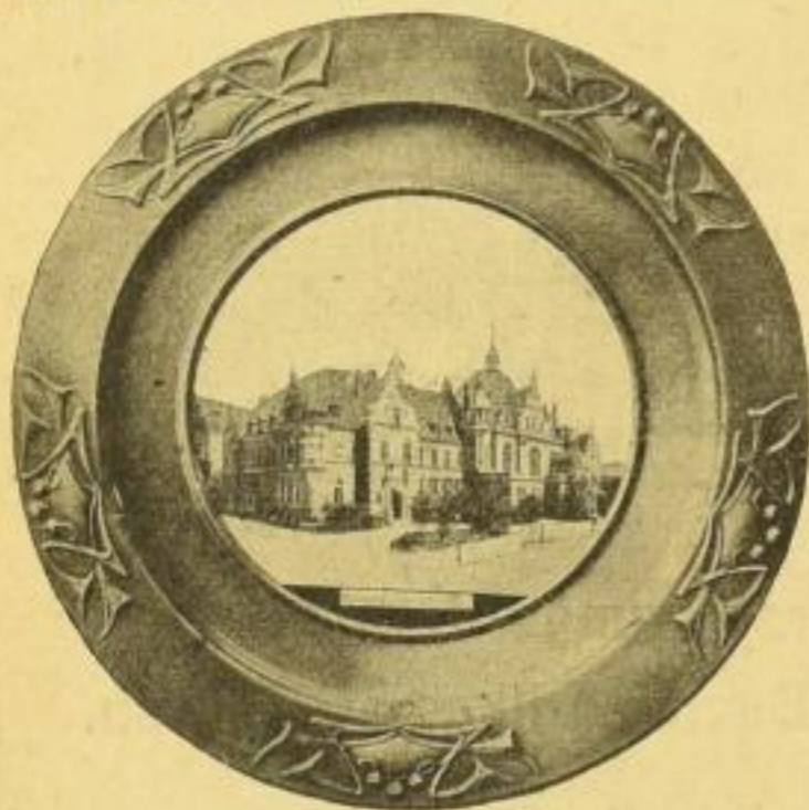
Deutsches Buchhändlerhaus in Leipzig