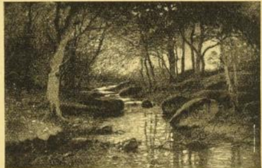
No. 113. MÜLLER-KURZWELLY: Herbstgold (Ilsetal). Bild 47×72 cm, Karton 77×95 cm. M. 25.— ord. „ 33½×51 „ „ 57×75 „ „ 12.50 „

Studie zum Original in der Kgl. National-Galerie Berlin.