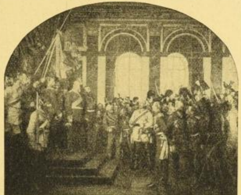
No. 127. A. v. WERNER: Kaiserproklamation in Versailles. Bild 59×71 cm, Karton 77×98 cm. M. 25.— ord. Prachtausgabe: Bild 78×94 cm, Karton 108×129 cm. M. 50.— ord.

Als Gegenstück zu No. 127 erschienen folgende Ruhmes- hallenbilder: Freiwillige von 1813 Leipzig Belle-Alliance Königgrätz St. Privat je M. 25.— ord.