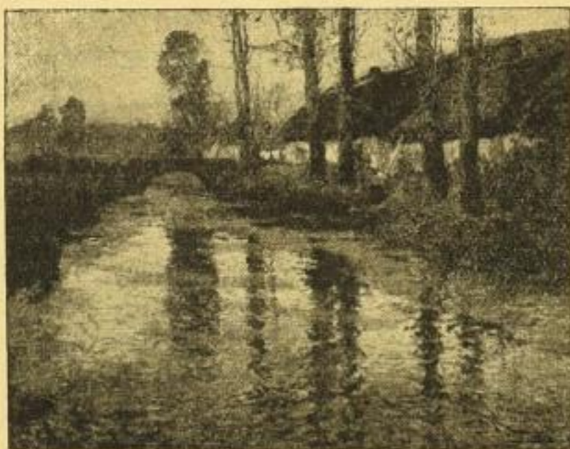
No. 167. FRITS THAULOW: Novembertag in der Normandie. Bild 51½×66½ cm, Karton 78×102 cm. M. 25.— ord.

Studie zum Original in der Kgl. National-Galerie Berlin.