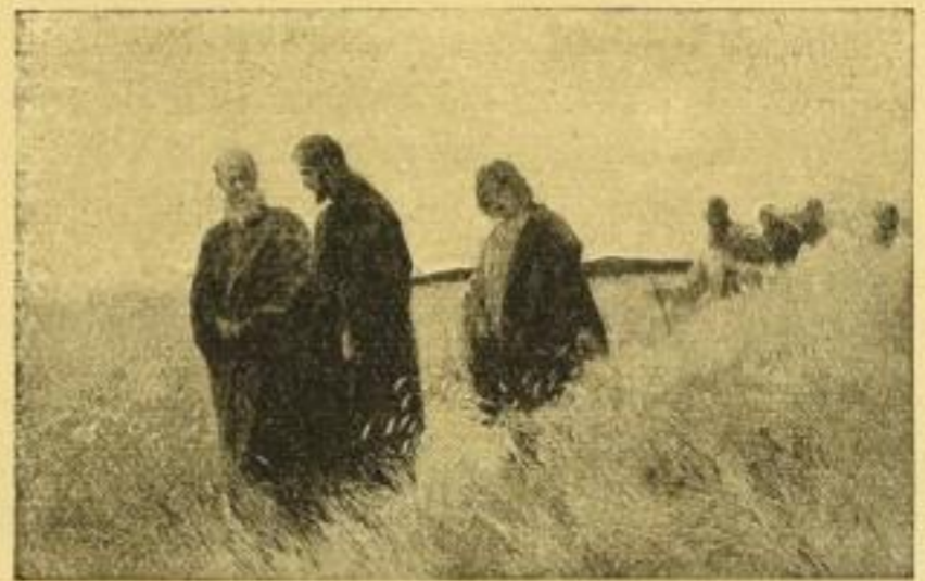
No. 137. J. R. WEHLE: Und sie folgten ihm nach. Bild 46×74 cm, Karton 72×98 cm. M. 25.— ord. „ 34×51½ „ „ 55×72 „ „ 12.50 „ „ 20×31½ „ „ 40×51 „ „ 6.25 „