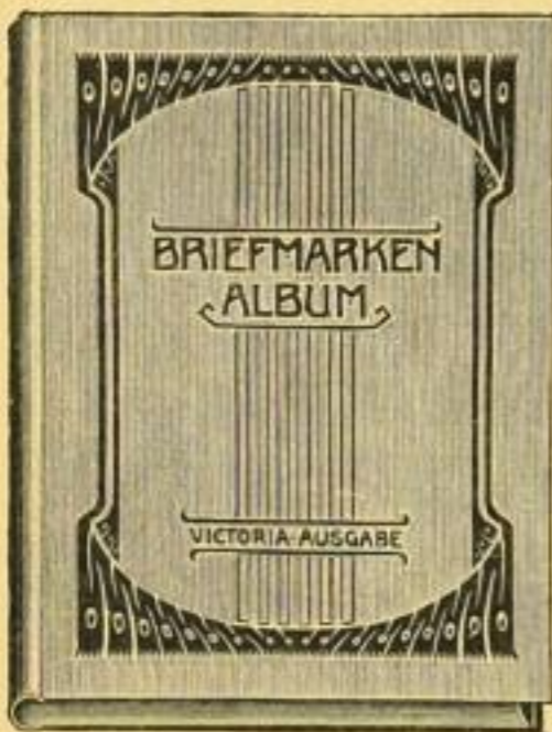
No. 20 F. Halblein 26x34 cm. 224 Seiten, 3263 Abbildungen, 23500 Markenpreise, 14000 Mar- kenfelder. M. 3.—