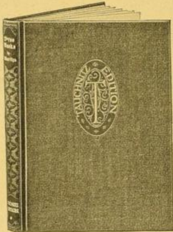
Original-Leinenband M. 2.20 ord.

Hierdurch zeige ich an, dass ich von jetzt ab die Bände der Tauchnitz Edition auch gebunden führe, und zwar in einem geschmackvollen roten Leineneinband und einem eleganten Geschenkeinband aus weichem Baumwollstoff, beide Einbände mit Golddruck, nach Zeichnungen von H. Steiner-Prag.