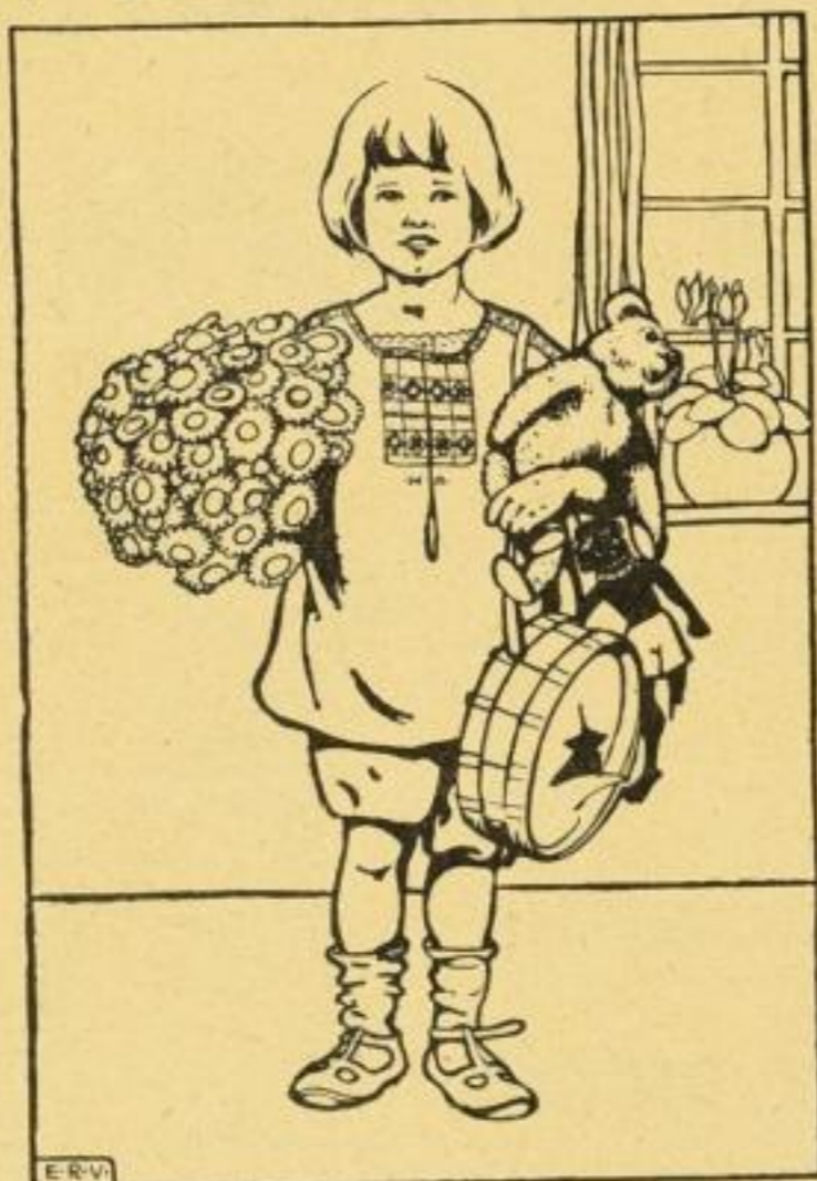
Alle Bilder sind bunt, 6-7facher Farbenbrud.

Verteilterte Bildproben mit Text aus „Mit Sang und Klang das Jahr entlang“!