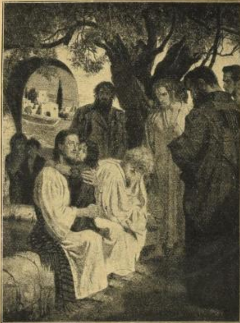
Nr. 207. F. Stassen, Werdet wie die Kinder. Bildgröße 46×62. M. 8.— ord.