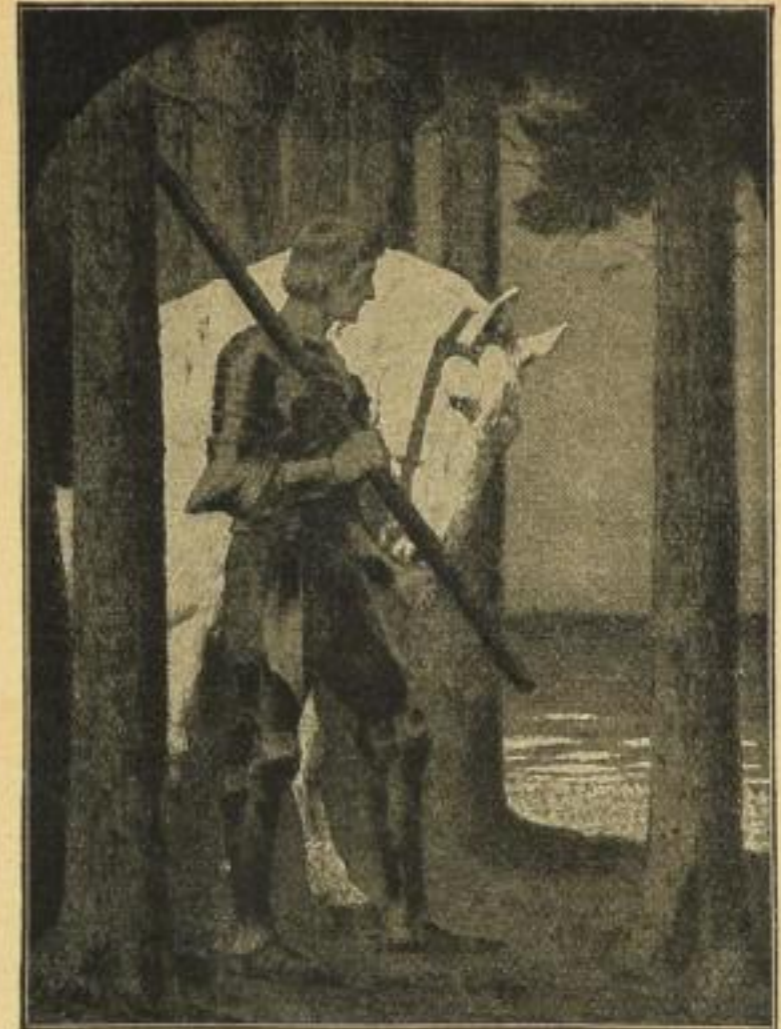
Nr. 209. F. Müller-Münster, Parsival. Bildgröße 46×62. M. 8.— ord.

Bei Bezügen über 500 M. pro Quartal schreiben wir 10% vom Netto-Betrage gut, prompte Abrechnung vorausgesetzt.