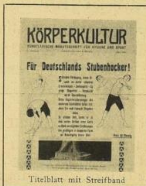
Titelblatt mit Streifband

Bei Absatz von 12 Heften 2 Gratisexemplare, bei 18 Heften 3, bei 24 Heften 4!