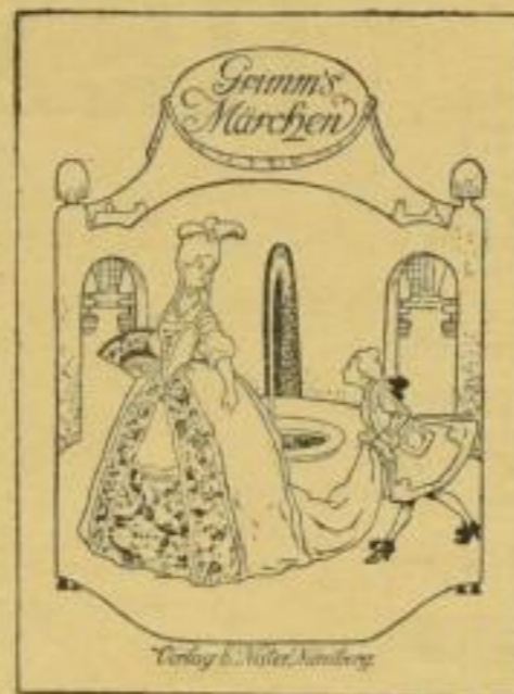
Prachtausgabe in Lw. M. 3.— Volksausgabe, kart. M. 2.—