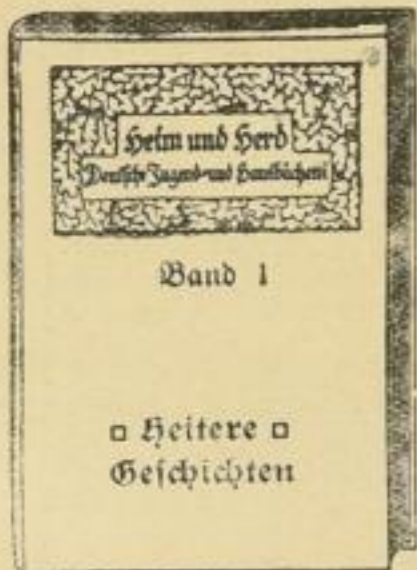
Preis geb. M. 1.—.

da hierdurch dem Beschauer am besten die Empfehlung des Prospektes in Erinnerung gebracht wird.