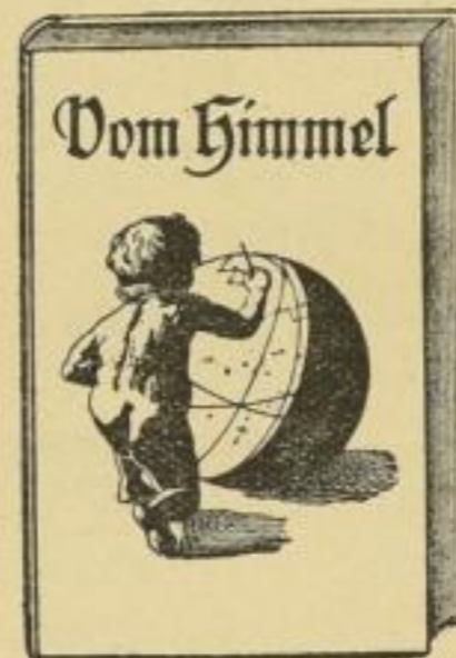
Preis geb. M. 1.50.