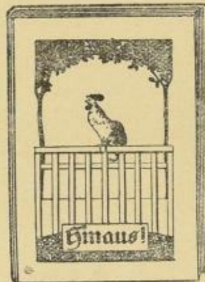
Preis geb. M. 1.80.