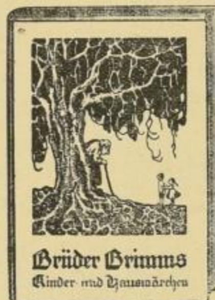
(Vollständige Ausgabe) Preis in Leinwand geb. nur M. 1.80.

Verbreitung dieses Prospektes angelegen sein lassen, sichern sich durch erhöhten Absatz der angezeigten Werke einen guten Nutzen, nament-