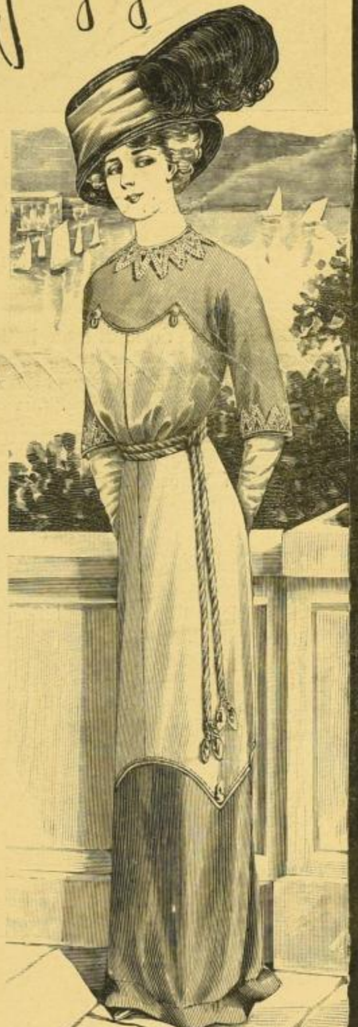
Probe-Illustration aus dem Modenteil von „Vobachs Frauen- u. Moden-Zeitung“.