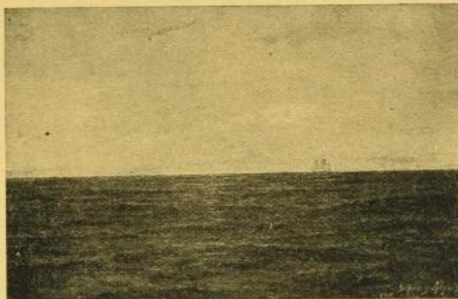
SONNENAUFANG AM ÄQUATOR. Bildgrösse 23 1/2 : 36 cm

Nach Originalen von Professor Schnars-Alquist, Hamburg