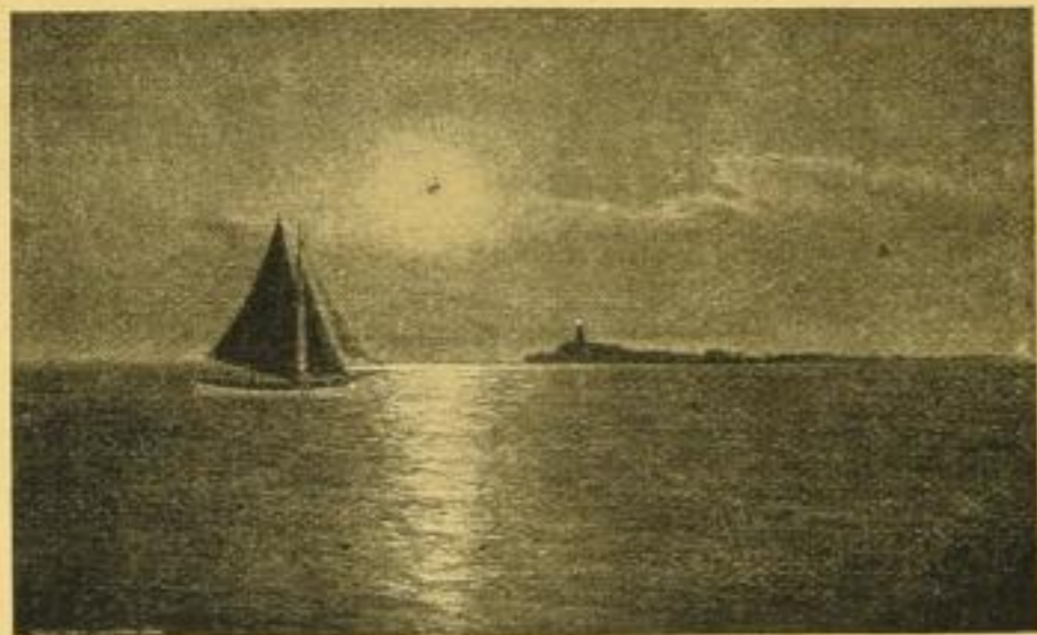
MONDNACHT. Bildgrösse 23 1/2 : 38 1/2 cm

In ca. 8—10 Tagen erscheinen in technisch vollendeten farbigen, originalgetreuen Wiedergaben: Copyright 1911