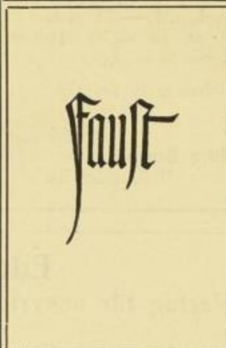
Goethes Faust (1. Tl.) Zweifarbiges Druck!