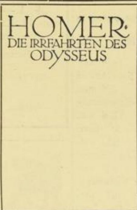
Die schönsten Gesänge Homers