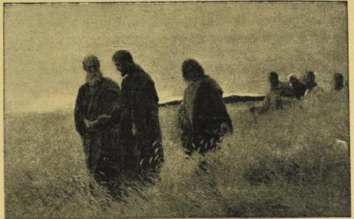
Nr. 137. Wehle: Und sie folgten ihm nach.

In obigem Altgoldrahmen, 100×115 cm, ord. 100.— M., netto 65.— M.