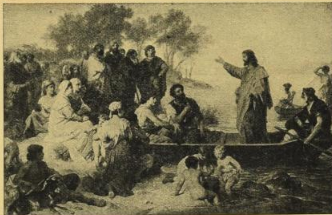
Nr. 200. Heinr. Hofmann: Christus predigt am See.

Klein: Bild 20×31 1/2 cm, Karton 40×51 cm, ord. 6.25 M., netto 3.75 M., ohne Karton netto 3.15 M.