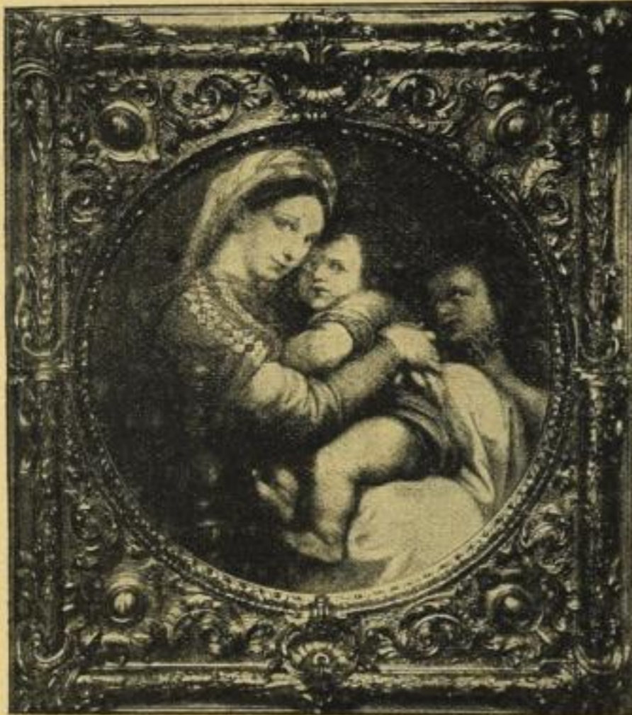
No. 2. Rafael: Madonna della Sedia.

Nach dem Original im Palazzo Pitti, Florenz.