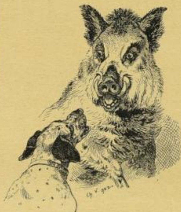
Aus „Forsthaus Falkenhorst“, Band V