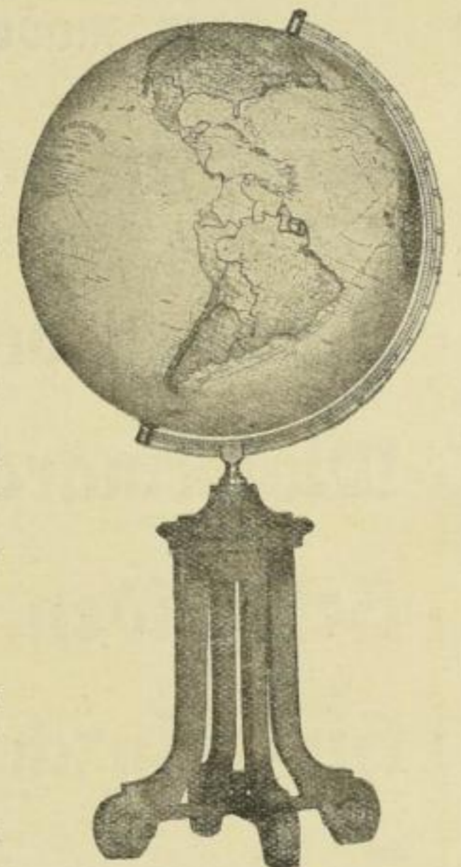
Erdglobus Nr. 53 M. 30.— ord., M. 18.— netto auf Eichengestell, mit Halbmeridian und Kompass Kugeldurchmesser: 34 cm Umfang der Kugel: 105 cm Gesamthöhe mit Fuss: 60 cm