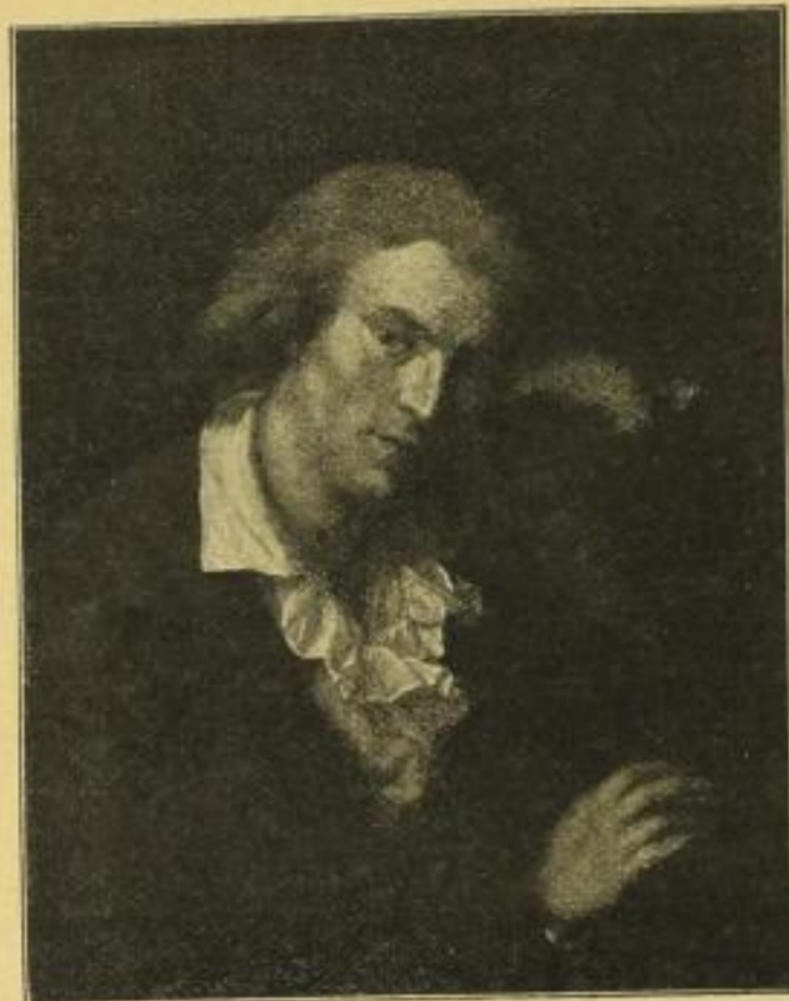
No. 220. Anton Graff, Schiller.

Farbige Kunstblätter nach berühmten Gemälden alter und neuer Meister Neuerscheinungen: