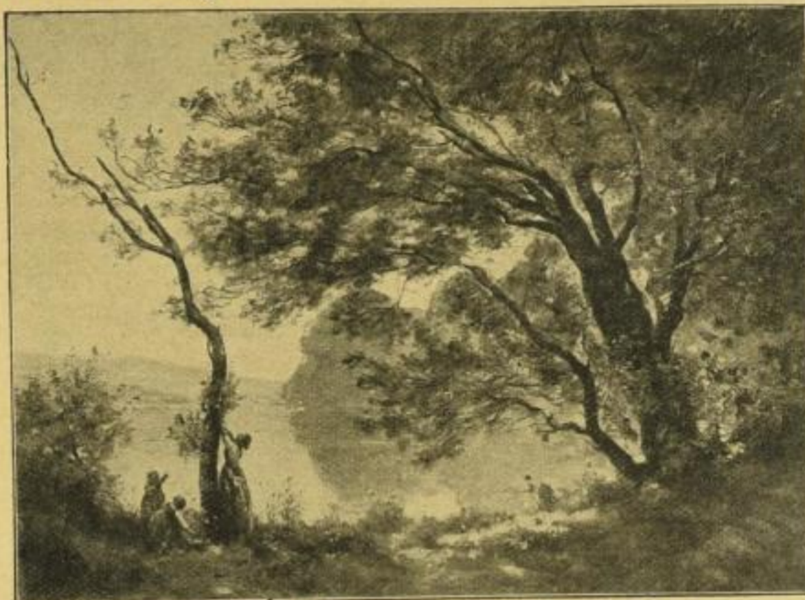
No. 231. Corot, Frühlingsmorgen. (Louvre, Paris.)

Haupt- katalog mit 180 Abbil- dungen: 60 Pf.