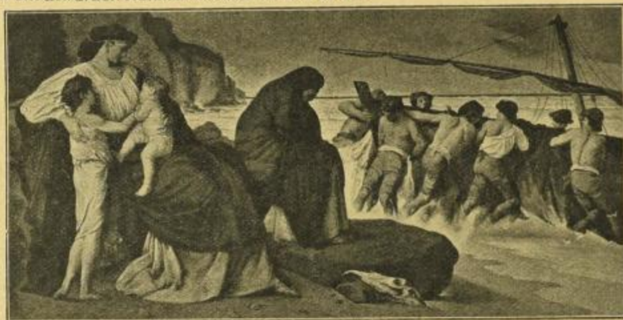
No. 227. Anselm Feuerbach, Medea (Neue Pinakothek, München) Bildgröße 48 × 97½ cm, Passepartout 78 × 125 cm ord. M. 35.- Im angepassten Allgoldrahmen 64 × 113 cm ord. M. 70.-

Bild 50 × 68 cm, weisser Karton mit Titel 73 × 96 cm ord. M. 25.- Im Mahagonirahmen mit Bronzefolien 64 × 82 cm ord. M. 45.-