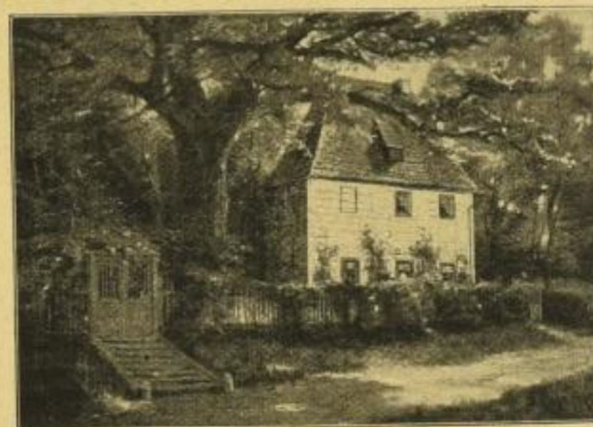
No. 223. v. Eschwege, Goethes Gartenhaus in Weimar. Bild 35 × 49 cm, weiss. Kart. m. Tit. 56 × 72 cm ord. M. 12.50 In Biedermeier-(Mahag.) Rahm. 43 × 57 cm ord. M. 25.-

Bild 46½ × 66 cm, weisser Karton mit Titel 72½ × 96 cm ord. M. 25.- In holländischem Rahmen mit Goldfalz 61 × 81 cm ord. M. 42.-