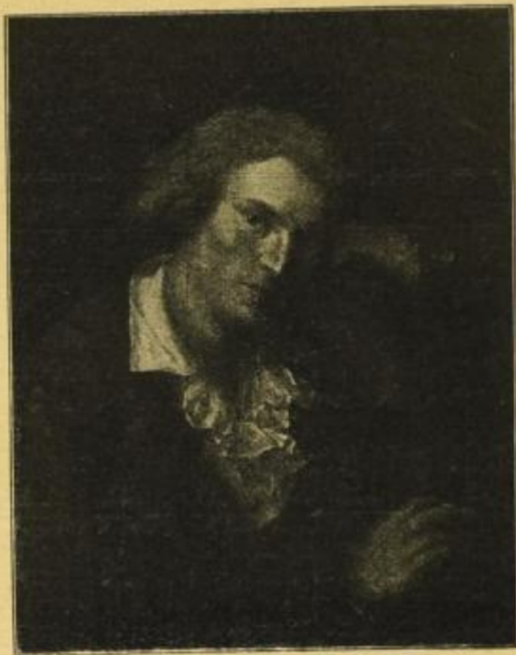
No. 220. Anton Graff, Schiller.

Farbige Kunstblätter nach berühmten Gemälden alter und neuer Meister Neuerscheinungen: