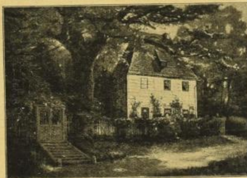
No. 223. v. Eschwege, Goethes Gartenhaus in Weimar.

Bild 46½×66 cm, weisser Karton mit Titel 72½×96 cm ord. M. 25.- In holländischem Rahmen mit Goldfalz 61×81 cm ord. M. 42.-