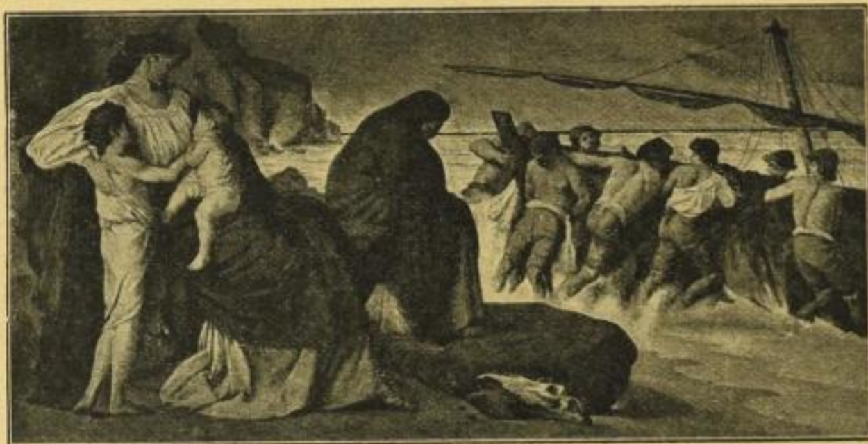
No. 227. Anselm Feuerbach, Medea (Neue Pinakothek, München) Bildgrösse 48×97½ cm, Passepartout 78×125 cm ord. M. 35.- Im angepassten Allgoldrahmen 64×113 cm ord. M. 70.-

Bild 50×68 cm, weisser Karton mit Titel 73×96 cm ord. M. 25.- Im Mahagonirahmen mit Bronzelinien 64×82 cm ord. M. 45.-