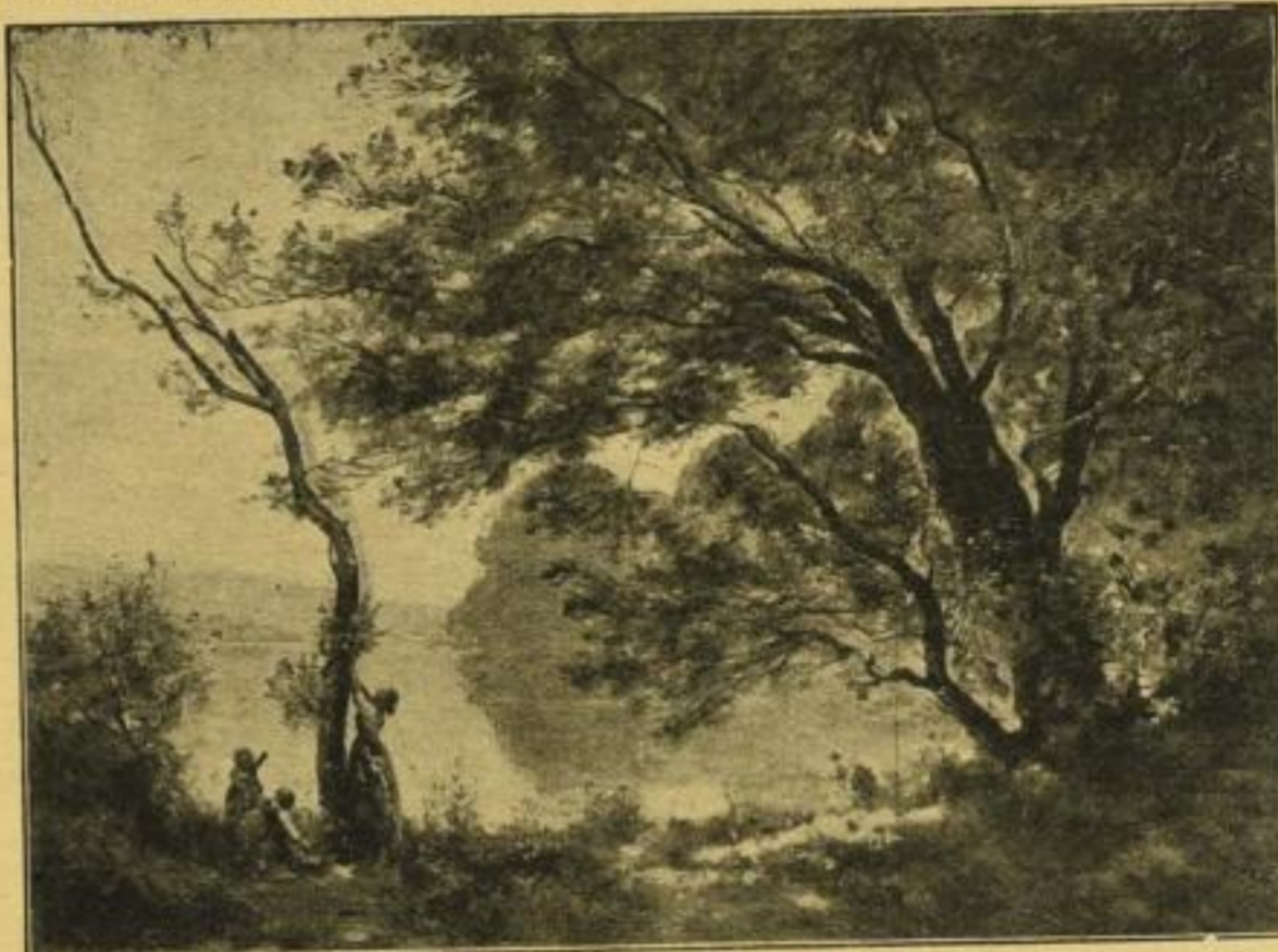
No. 231. Corot, Frühlingsmorgen. (Louvre, Paris.)

Haupt- katalog mit 180 Abbil- dungen: 60 Pf.