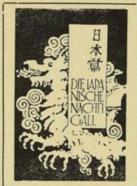
Mehrfarbig handkolorierte Titelzeichnung.

In zweiter Auflage innerhalb zwei Monaten versenden wir dieser Tage