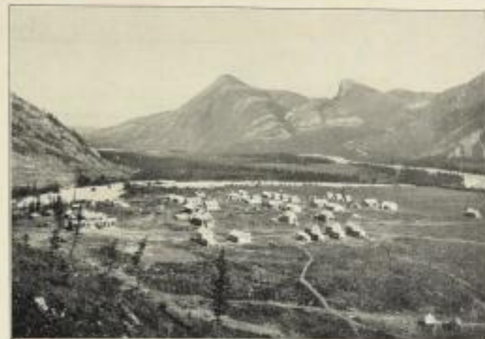
Eine typische junge Ansiedlung in Kanada. Exshaw Alberta.