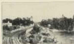
Blick auf die Regierungshausse von Ottawa.

Illustrierte farbige Prospekte fürs Publikum und Subskriptionslisten stehen kostenlos zur Verfügung :: Günstige Bedingungen!