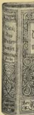
Einband und s-Ausgabe

Herdersche Verlagshandlung / Freiburg i. Br.