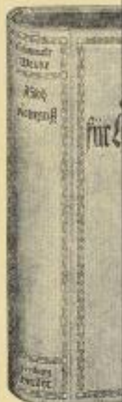
Einband und s-Ausgabe

Ein Probe-Exemplar der Oktav-Ausgabe komplett und fest gebunden bis 30. Juni 1913 mit 50% Rabatt