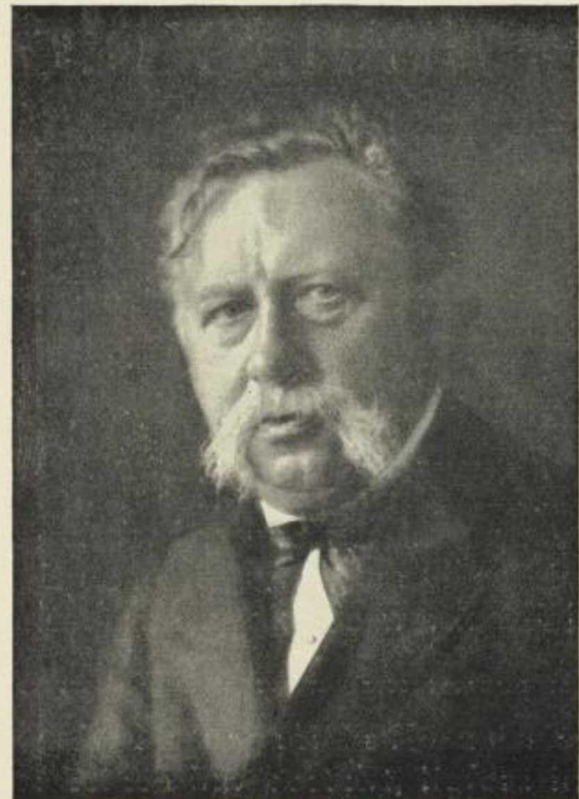
HERMANN KRETZSCHMAR Verfasser des „Führer durch den Concertsaal“

Wir bitten zu verlangen. Bestellzettel liegt bei.