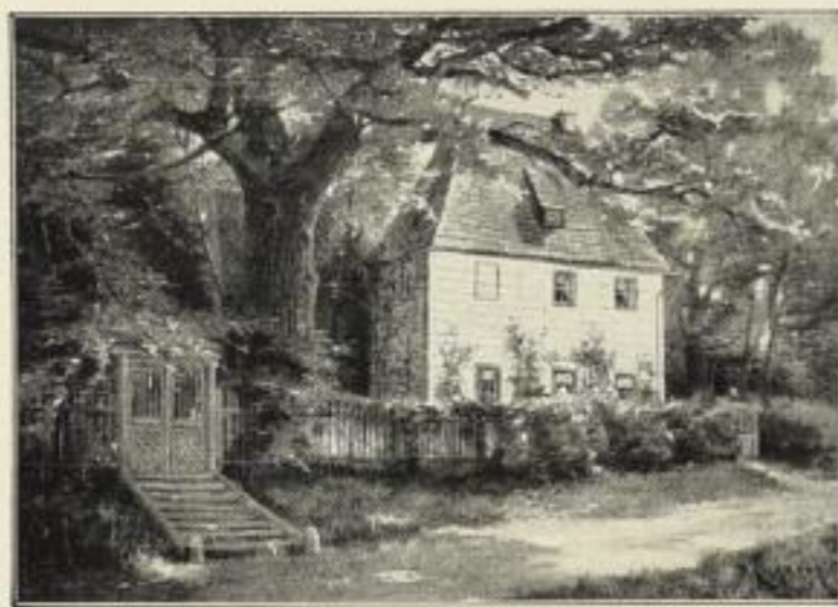
Nr. 223. E. v. ESCHWEGE: Goethes Gartenhaus in Weimar. Bild 34½ × 49 cm, auf weißem Karton 56½ × 72 cm ord. 12.50 M., netto 7.50 M. Im Mahagonirahmen 42 × 57 cm, ord. 24.- M., no. 16.- M.