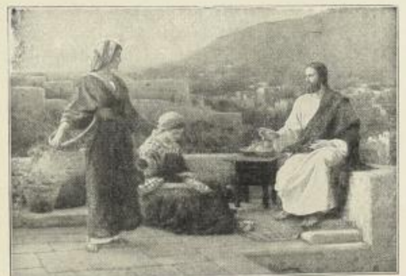
Nr. 165. H. SEEGER: Jesus bei Maria und Martha. Bild 50 × 71½ cm, in Passep. 77 × 95 cm, ord. 25.- M. Ohne Passep. netto 12.50 M., mit Passep. netto 15.- M. Im schwarzgebeizten Eichenrahmen 90 × 108 cm ord. 45.- M., netto 30.- M.