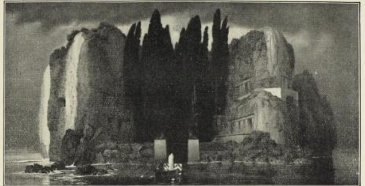
Nr. 146. BOCKLIN: Die Insel der Toten. (Städtisches Museum, Leipzig.) Bild 35½ × 68 cm, auf weiß. Karton 58 × 86 cm, ord. 25.- M., netto 15.- M. Im Gold-Motivrahmen 50 × 83 cm, ord. 55.- M., netto 35.- M. Im Mahagonirahmen " " " 45.- " " 30.- "

Ausstellung für christliche Kunst Düsseldorf 1909.