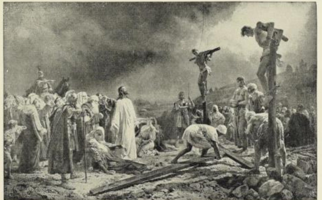
Nr. 176. HERMANN CLEMENTZ: Golgatha. Bildgröße 61½ × 96½ cm, im Passep. 97 × 125 cm, ord. 35.- M. Ohne Passep. netto 17.50 M., mit Passep. netto 21.- M. Im altholländ. Rahmen (mit Goldfalz) 77 × 112 cm, ord. 70.- M., netto 46.50 M.

Ausstellung für christliche Kunst Düsseldorf 1909.