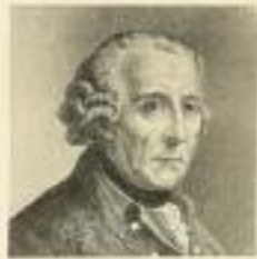
Friedrich der Große