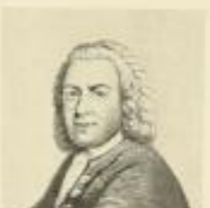
J. B. Sebastian Bach