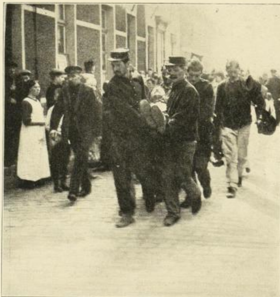
Von der Beschiessung Antwerpens.

Ein schwerverwundeter belgischer Soldat wird zum Lazarett getragen.