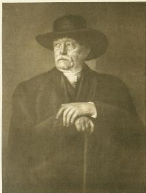
Franz von Lenbach: Fürst Bismarck.

Das anerkannt beste Bismarck-Bildnis ist als ganzseitige Sonderbeilage in Kaplerdruck der ersten Lieferung beigelegt.