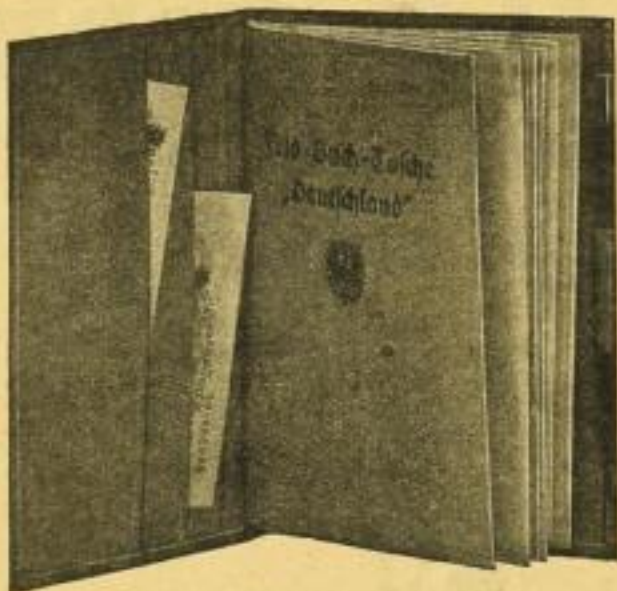
Nr. 36. Feldbuch-Tasche aus Rohleinstoff, innen mit Klemmtaschen, Notizbuch mit Bleistiftlöse und Bleistift, Auf- druck: Eisernes Kreuz in Aluminium und Schwarz. Format 11:16,3 cm

Ein nützliches Geschenk für jeden im Felde befindlichen Krieger