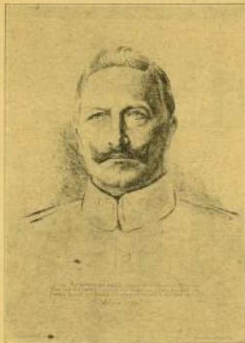
Kaiser Wilhelm II.

Kaiser Wilhelm II. :: Kaiser Franz Josef :: Kronprinz Wilhelm :: Kronprinz Rupprecht :: Hindenburg.