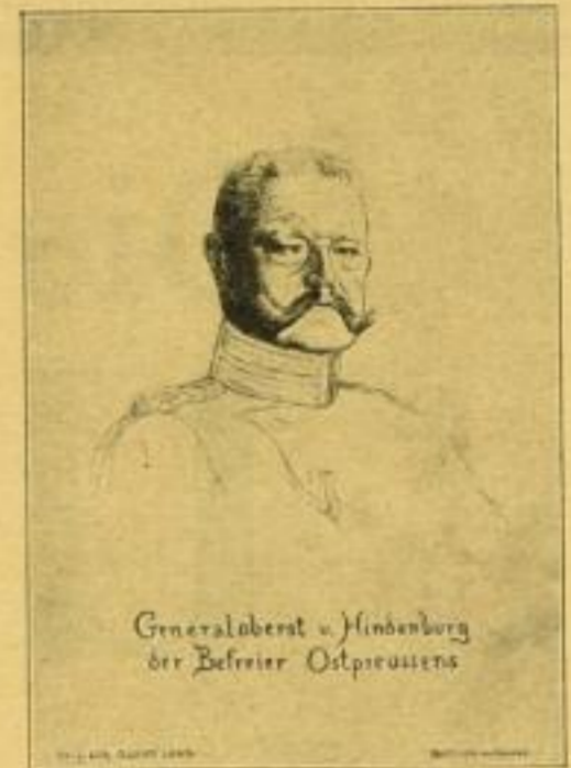
Generaloberst v. Hindenburg der Befreier Ostpreußens Feldmarschall v. Hindenburg Orig.-Lithogr. von Oskar Lang