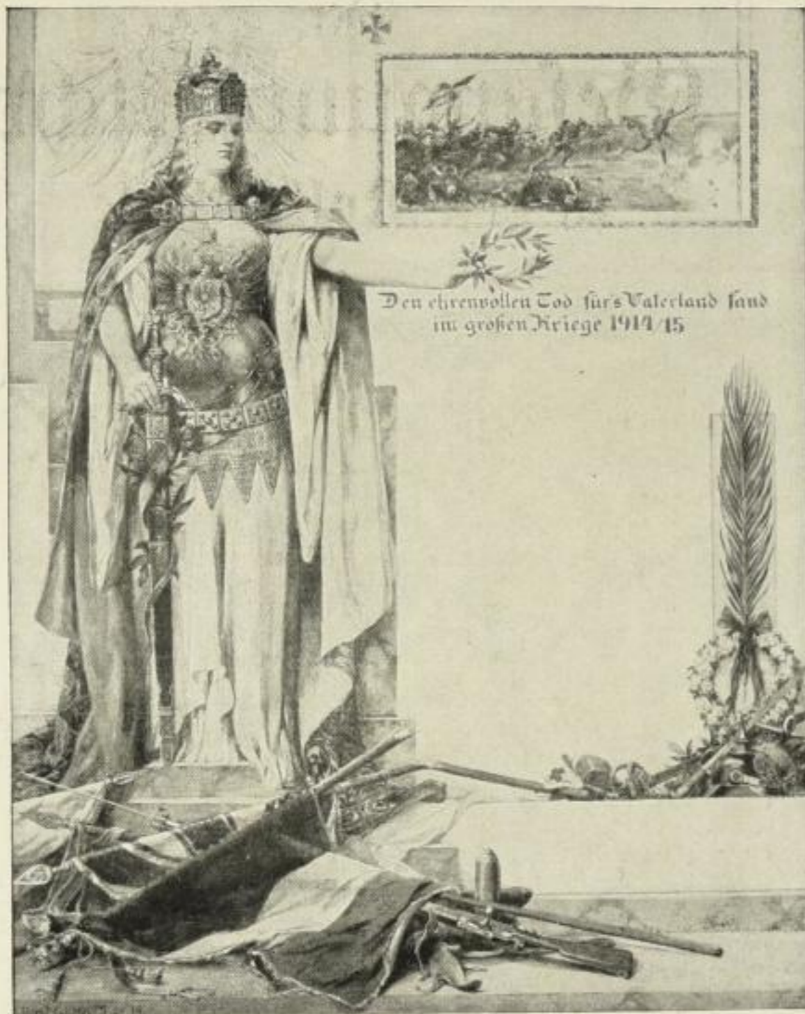
Eigentum u. Verlag von Emil Roth in Gießen 1915. Gesehlich geschützt. Verkleinerte Abbildung.