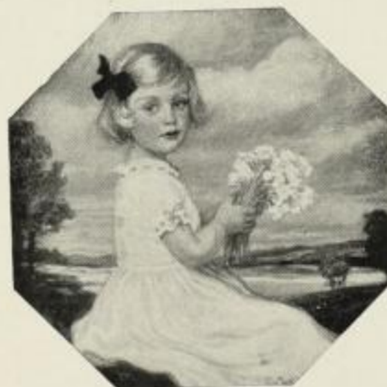
C. Max, Frühlingsgrüsse Farbenlichtdruck Bildgr. 29:29 cm 6.—