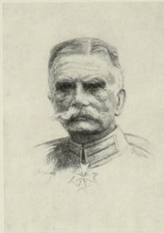
W. Schodde, v. Mackensen Kupferätzung 26:19,5 cm 2.50