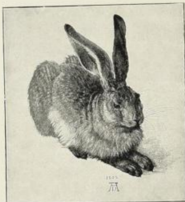
A. Dürer, Hase Bildgr. 18:20 cm Vierfarbendruck 1.—