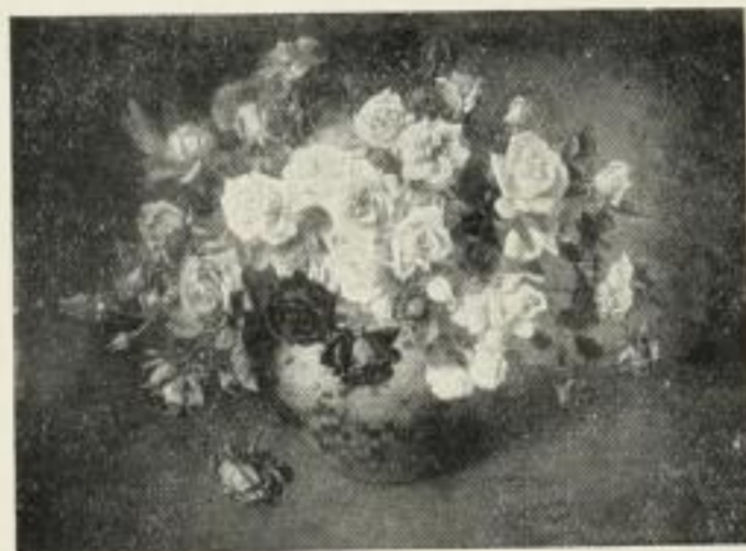
H. Buchner, Rosen Farbenlichtdruck 56:75 cm 25.— Farbenlichtdruck 33:43,7 „ 6.— Vierfarbendruck 9:12 „ 0.50