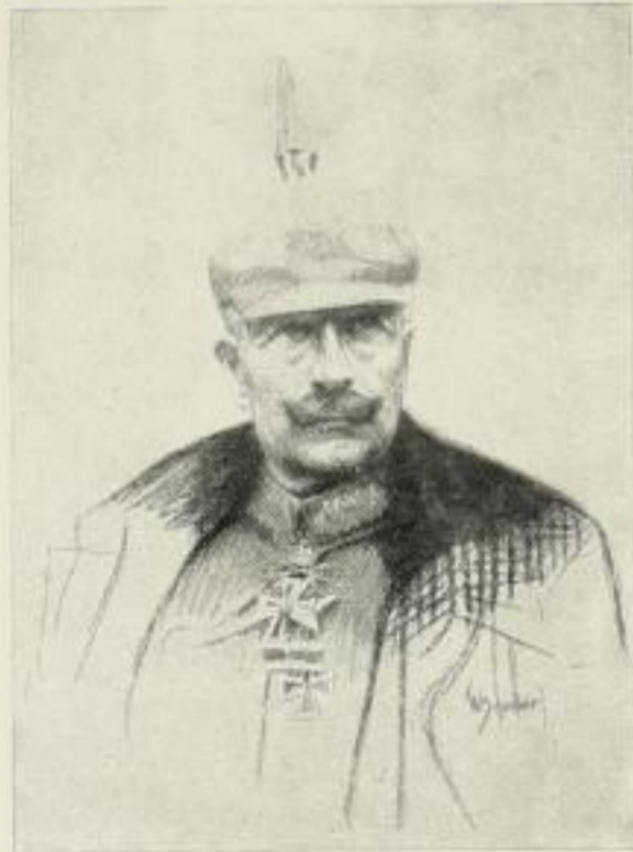
W. Schodde, Kaiser Wilhelm II. Kupferätzung 64:48 cm E 15.— F 30.— 27:19 cm E 3.— F 12.— Original-Steinzeichnung 74:54 cm K auf Japan 20.— S 6.— Lichtdruck 24:18 cm m. Gedicht 1.25 o. Gedicht 1.—

Ⓩ Von den seit Ausbruch des Krieges eingegangenen schriftlichen Bestellungen haben wir eine interessante Statistik aufgestellt und geben in folgendem eine Zusammenstellung der während dieser Zeit am meisten schriftlich bestellten Blätter. Diese Zusammenstellung enthält 21 Abbildungen derjenigen Blätter, die sich in der wirtschaftlich schwersten Zeit als durchaus gangbar erwiesen haben; sie auf Lager vorrätig zu halten bedeutet also kein Risiko. Alle Blätter liefern wir auf Wunsch auch gerahmt, mit Preisen stehen wir gern zu Diensten.