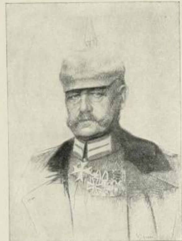
W. Schodde, von Hindenburg Kupferätzung 64:48 cm E 15.— F 30.— 27:19 cm E 3.— F 12.— Original-Steinzeichnung 74:54 cm K auf Japan 20.— S 6.— Lichtdruck 24:18 cm m. Gedicht 1.25 o. Gedicht 1.—