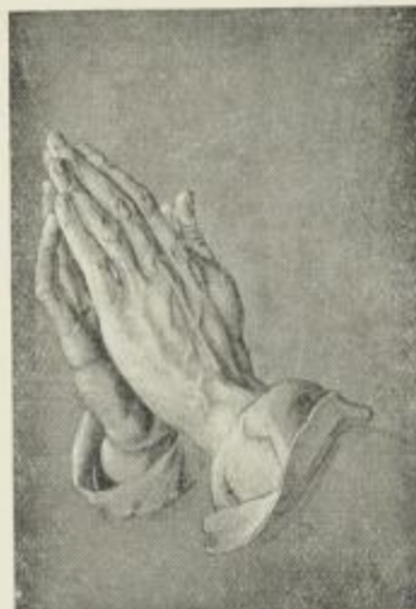
A. Dürer, Betende Hände Bildgr. 29:19 cm Vierfarbendruck 1.—