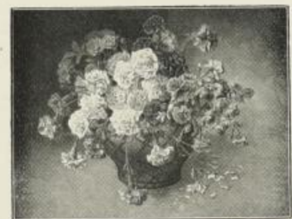
H. Buchner, Nelken und Rosen Farbenlichtdruck 56:75 cm 25.— auf Leinwand und Keilrahmen 40.— Farbenlichtdruck 33:43,7 cm 6.— Vierfarbendruck 9:12 „ 0.50