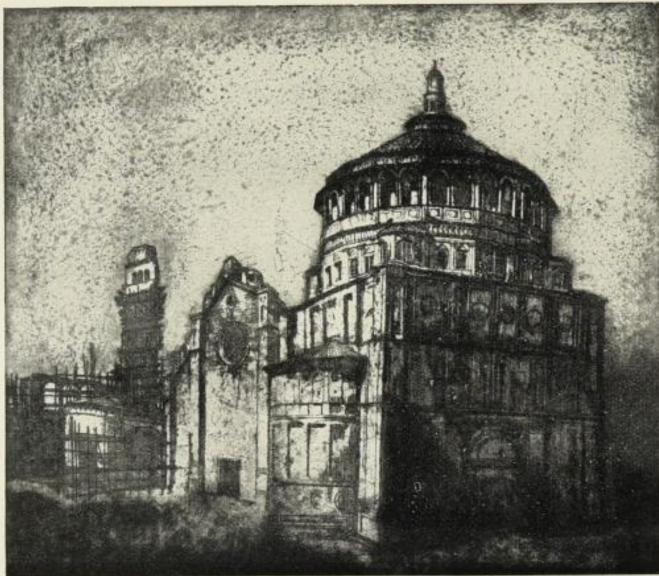
Nr. 10. Santa Maria delle Grazie, Mailand. 250 Mark Preisverzeichnis der Radierungen und Rundschreiben über die Exlibris-Mappe auf Verlangen. Radierungen wie Exlibris werden auf Wunsch einige Zeit zur Ansicht übersandt.