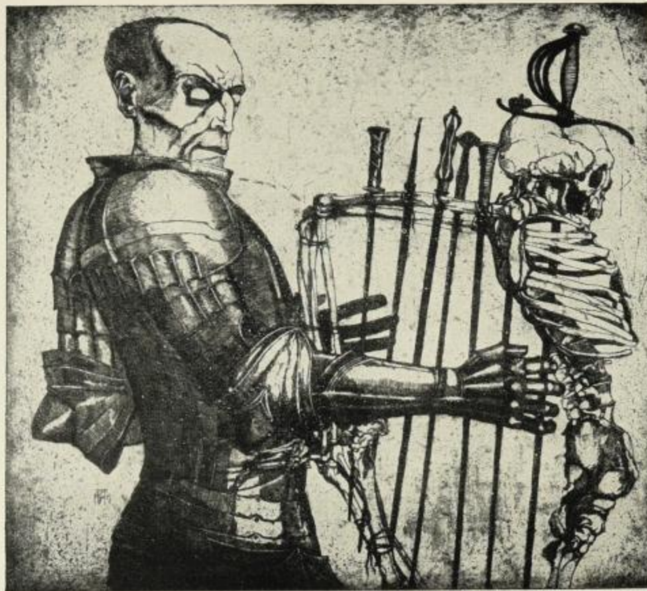
Nr. 28. Der vom Kriege singt. 350 Mark Ein vornehmes, zeitgemässes Weihnachts-Geschenk