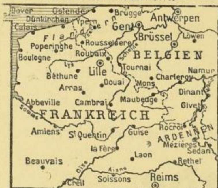
Grösse: 90 x 78 cm