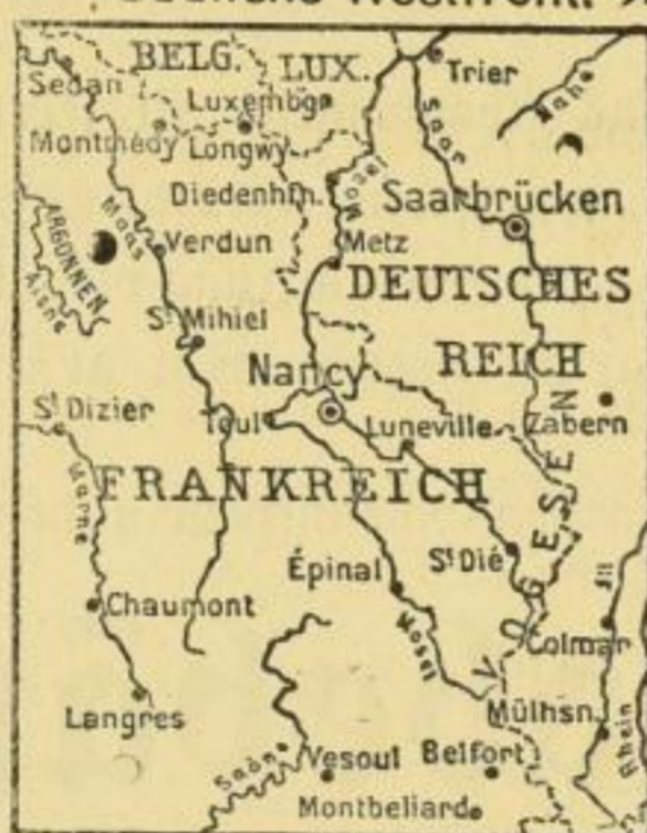
Grösse: 88 x 71 cm