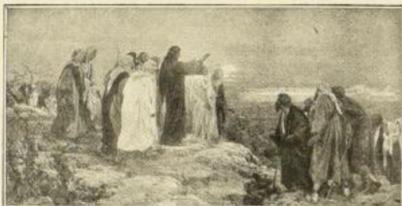
E. Simonet. Christus weissagend 522 Kupferätzung, 18:35 cm M. 5.—