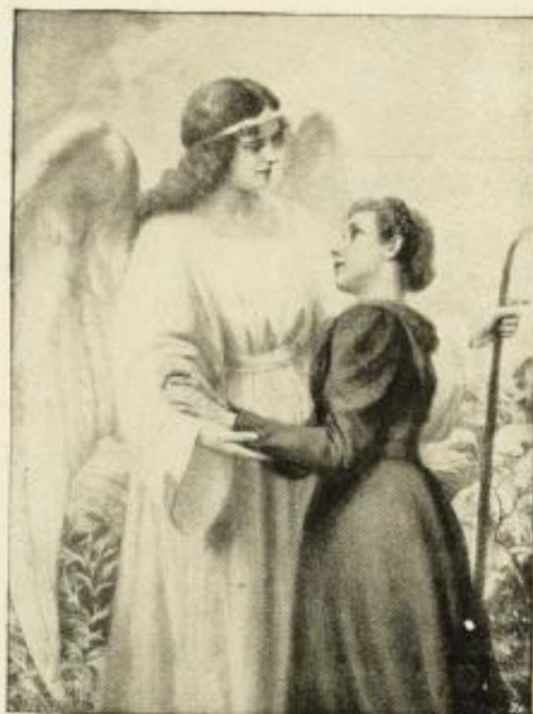
H. Lüdeke. Schutzengel 7378 Kupferätzung, 65:49 cm . . . . . M. 20.— Nimm meine Hände und führe mich! 7379 Kupferätzung 50:38 cm M. 10.—, koloriert M. 20.— Folio M. 3.—, Kabinett M. 1.—