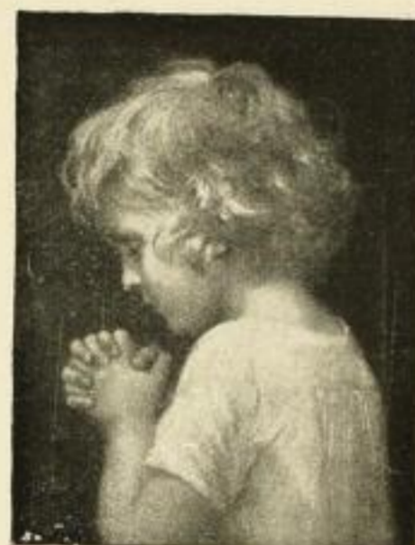
Karl Storch. Abendgebet 7509 Kupferätzung 33:25 cm M. 10.—, koloriert M. 15.— Folio M. 3.—, Kabinett M. 1.—