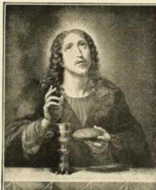
Carlo Dolci. Und er nahm das Brot 83 Kupferätzung, 33:27 cm, M. 5.—, Folio M. 3.—