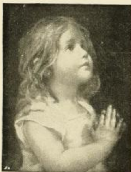
Karl Storch. Morgengebet 7508 Kupferätzung 33:25 cm M. 10.—, koloriert M. 15.— Folio M. 3.—, Kabinett M. 1.—