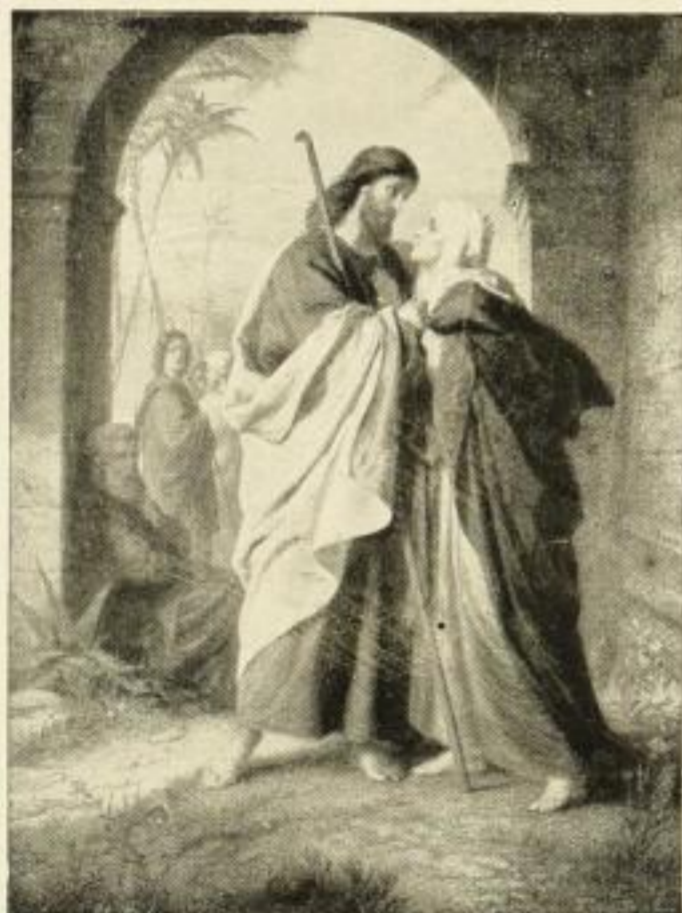
Bernh. Plockhorst. Christi Abschied 255 Stich von P. Habelmann, 57:43 cm M. 20.— 7386 Kupferätzung . . . . . 50:36 cm M. 10.— Folio M. 3.— . . . . . Kabinett M. 1.—