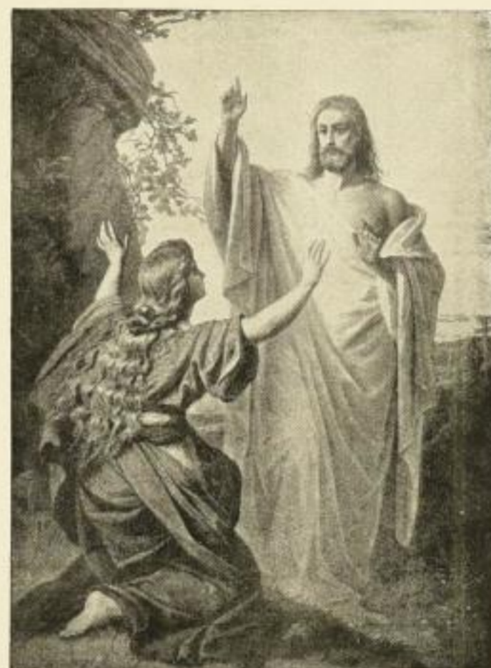
Bernh. Plockhorst. Am Ostermorgen 256 Stich von P. Habelmann, 57:43 cm M. 20.— 7387 Kupferätzung . . . . . 50:36 cm M. 10.— Folio M. 3.— . . . . . Kabinett M. 1.—

Katalog-Auszug „Religiöse Bilder“ mit 60 Abbildungen unberechnet und