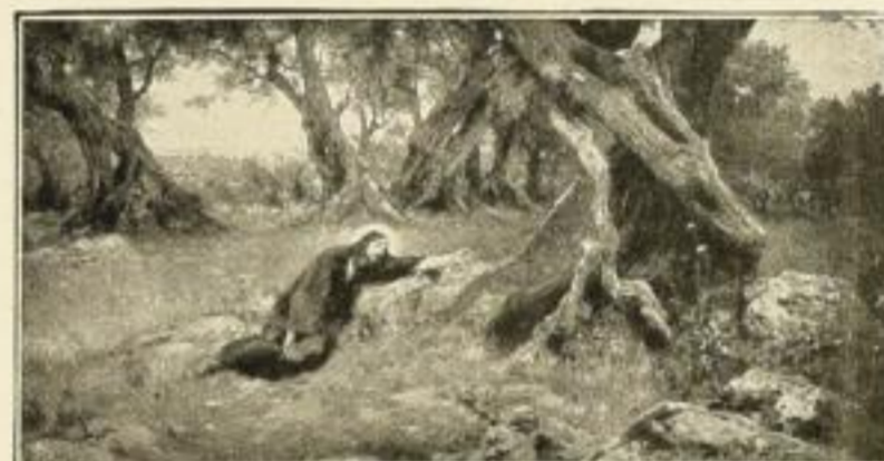
E. Simonet. Gethsemane 523 Kupferätzung, 18:35 cm M. 5.—