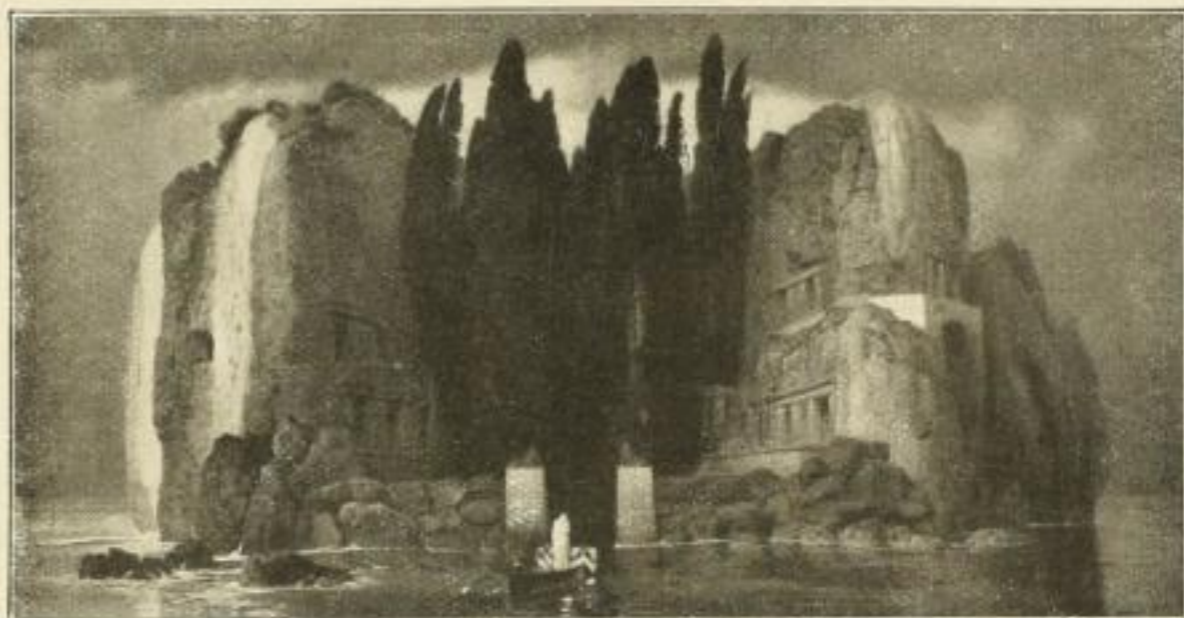
No. 146. BÖCKLIN: Die Insel der Toten (Städt. Museum, Leipzig) Bild 35 1/2 x 68 cm, weisser Karton mit Titel 60 x 90 cm M. 25.— Im dunklen, rötlichen Mahagonirahmen 49 x 82 cm . . . M. 45.— Im Bronze-Patina-Rahmen 47 x 80 cm . . . . . M. 48.—