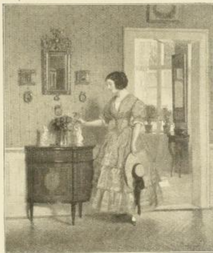
No. 273. FR. BAYERLEIN: Tage der Rosen Bild 43 x 51 cm, auf weissem Karton 61 x 73 cm M. 12,50 Im Mahagonirahmen 53 x 61 cm . . . . . M. 30.—