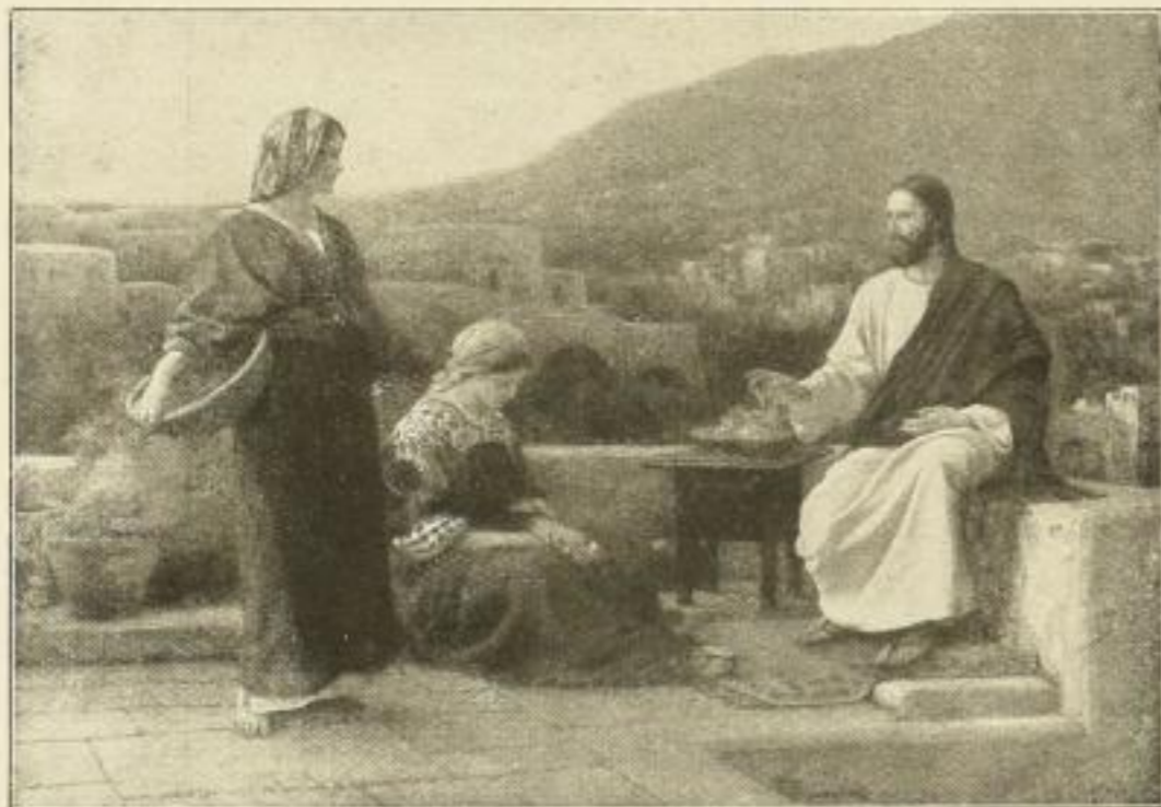
No. 165. H. SEEGER: Jesus bei Maria und Martha Bild 50 x 71 1/2 cm, im Passepartout 77 x 95 cm M. 25.— Im angepassten Goldrahmen 65 x 86 cm . . . . . M. 50.—