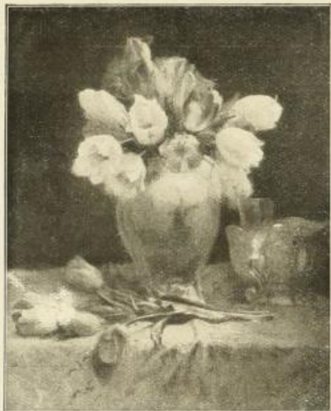
No. 238. HOFFMANN: Tulpen Bild 55 x 69 cm, weisser Karton 72 x 95 cm M. 25.— Im reichverzierten Altsilberrahmen 67 x 81 cm M. 70.—