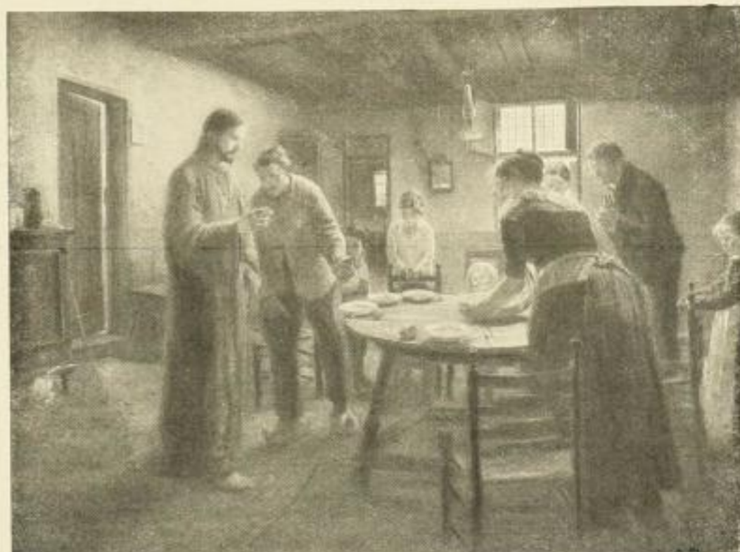
No. 271. FR. v. UHDE: Komm, Herr Jesu, sei unser Gast Bild 50 x 68 cm, weisser Karton 72 x 94 cm M. 25.— Im schwarzen Rahmen 65 x 83 cm . . . . . M. 46.—

Kunstanstalt Trowitzsch & Sohn, Frankfurt a. d. Oder