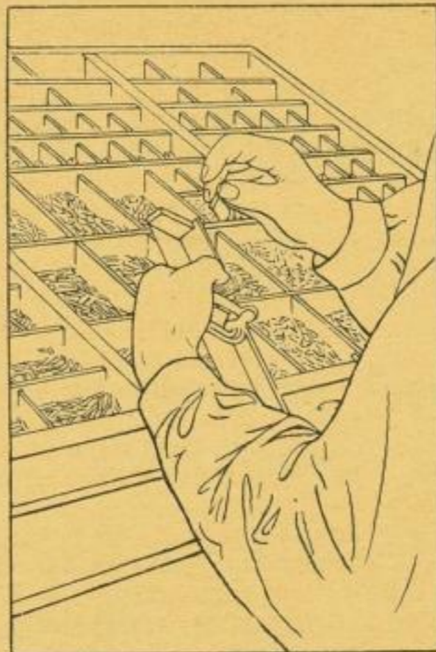
Handhaltung beim Setzen, Schriftkasten, Winkelhaken

hat. Der Winkelhaken faßt 6 bis 10 Zeilen; sobald diese gesetzt sind, werden sie aus dem Winkelhaken auf das „Schiff“ gehoben, einem Rahmen von reichlicher Buchseitengröße mit Blechboden, in welchem die Zeilen zu Seiten, die der Buchdrucker „Kolumnen“ nennt, formiert werden. Vom Setzer aus gelangt der Satz an die Abziehpresse, um für die Hauskorrektur abgezogen zu werden, die alle durch den Setzer veranlaßten Fehler berichtigen soll, damit dem Verfasser ein völlig mit dem Manuskript überein-