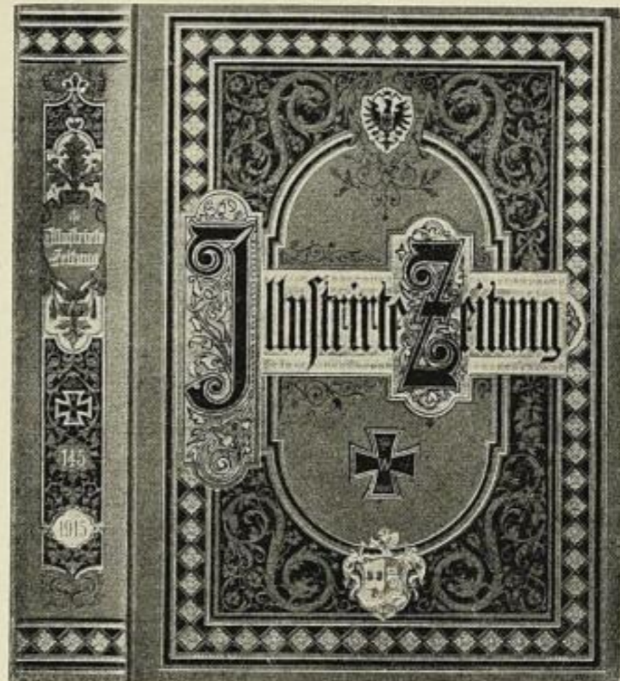
Halbjahrsdecke mit Titel und reicher Verzierung in Echthgold 4 M. 50 Pf. ord., 3 M. 35 Pf. bar. (In dieser Ausführung gibt es auch Vierteljahrsdecken mit entsprechend schwächerem Rücken 4 M. 50 Pf. ord., 3 M. 35 Pf. bar.)