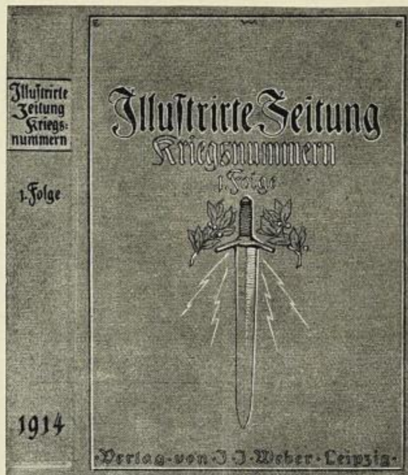
Decke für die Kriegsnummern-Folgen. 1. Folge: August bis Dezember 1914, jede weitere Folge deckt sich ab Januar 1915 mit dem Kalenderhalbjahr. Decke für je eine Folge 3 M. 50 Pf. ord., 2 M. 40 Pf. bar.

Die ersten zwei Einbanddecken sind die gewöhnlichen laufenden wie in Friedenszeiten; nur das Eisene Kreuz ist hinzugefügt. Die untere Decke (3) ist für die bestimmt, die sich die Kriegsnummern gesondert binden lassen. Die verschiedenen Decken, für die wir keine Vorsatzpapiere mitliefern, sind für die vollständigen Nummern, einschließlich Umschlag und Anzeigenteil, bestimmt. Die Preise mußten infolge der außerordentlich gesteigerten Ausgaben für Rohstoffe erhöht werden. Für die hier nicht besonders abgebildete Lesemappe zu Einzelnummern wurde der Preis auch auf 2 M. 50 Pf. ord., 1 M. 80 Pf. bar festgesetzt. Die besonderen Decken für die Kriegsnummern-Folgen (3) können wegen Mangel an Lein-