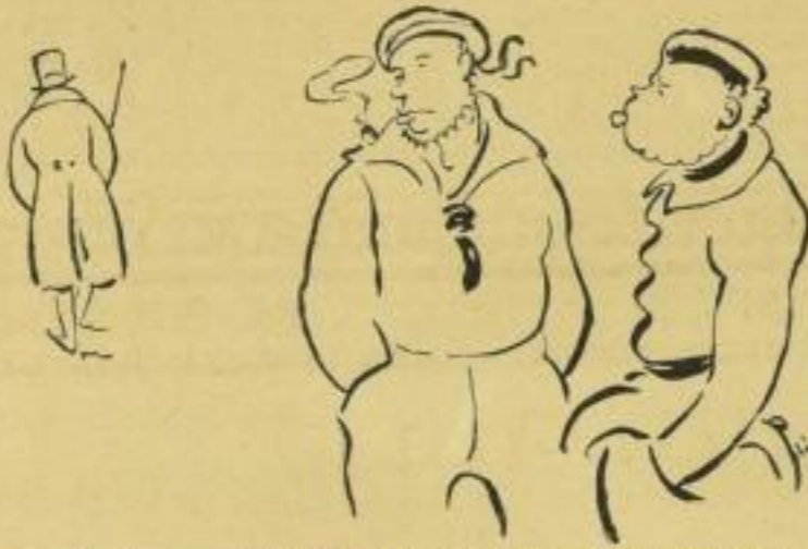
Start ver- feinerte Bild- probe aus „Hummel hummel“

Wat is he denn? He hett of man'n Mors ut twe helsten