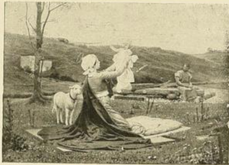
Nr. 172. FRANZ ZENISEK: Heilige Familie. Bild 72x98 cm . . . . . M. 27.50