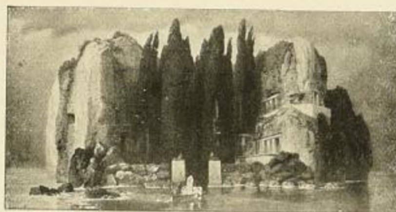
Nr. 146. BÖCKLIN: Toteninsel. Bild 35x68 cm, Rand 60x90 cm M. 27.50