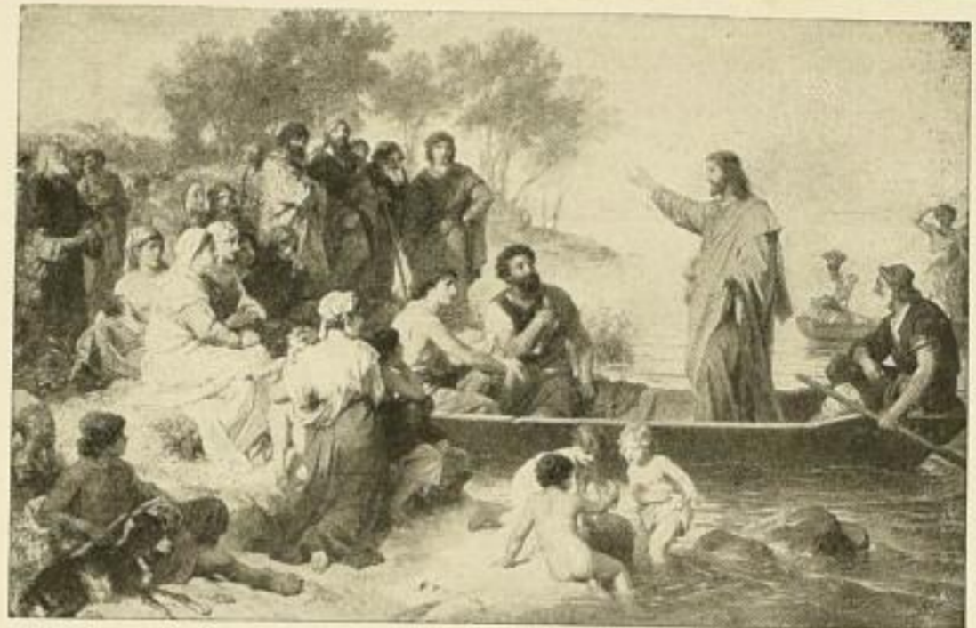
HEINR. HOFMANN: Seepredigt.