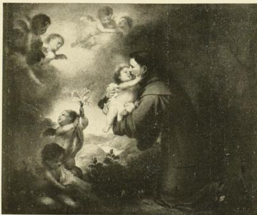
Nr. 252. MURILLO: Hl. Antonius. Bild 59x72 1/2 cm . M. 27.50 Im hohlgekehrten schwarzen Rahmen mit Goldfalz 74x88 cm . M. 70.—