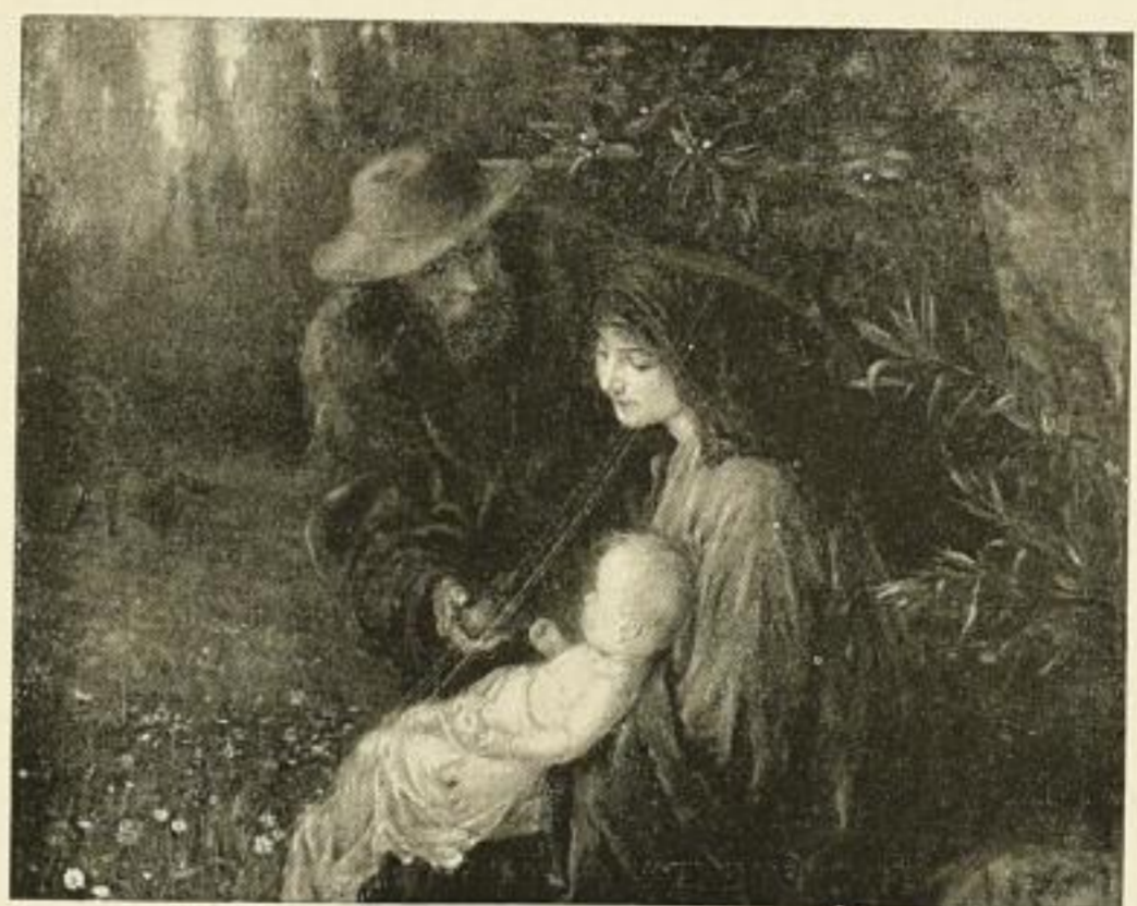
Nr. 195. E. ZIMMERMANN: Ruhe auf der Flucht. Bild 58x72 cm M. 27.50 Im angepassten altgoldenen Rahmen 71x85 cm . . . . . M. 70.—