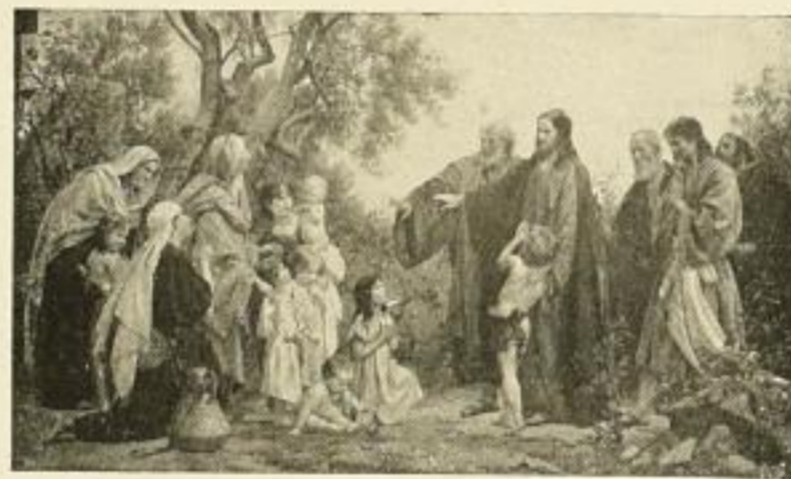
JUL. SCHMID: Lasset die Kindlein zu mir kommen. Nr. 132. Bild 43x74 cm . . . . . M. 27.50 Nr. 132a. Bild 33x56 cm, Rand 55x72 cm M. 13.75