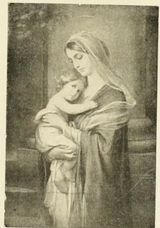
Nr. 153 UNTERSBERGER: Madonna mit Kind. Bild 65x97 cm . . . . . M. 27.50