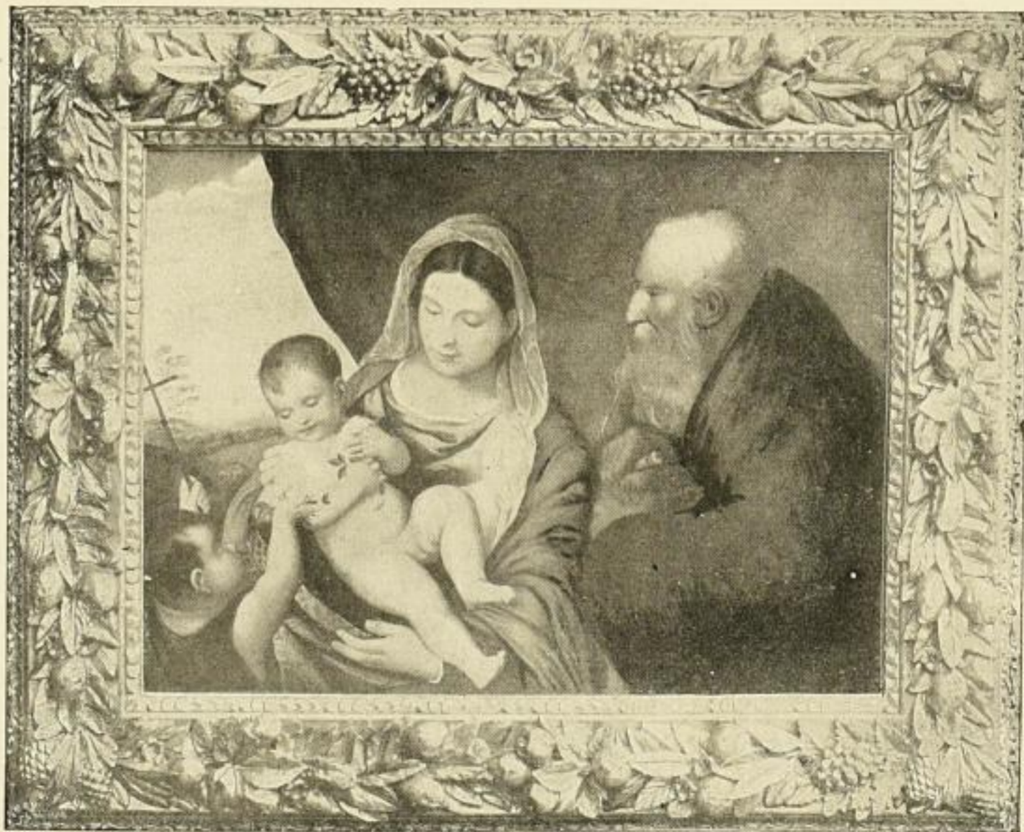
Nr. 27. TIZIAN: Santa Conversazione. Bild 66×92 cm . . . . . M. 27.50 In obigem reichverzierten Renaissancerahmen (Altgold) 101×128 cm . . . . . M. 240.—