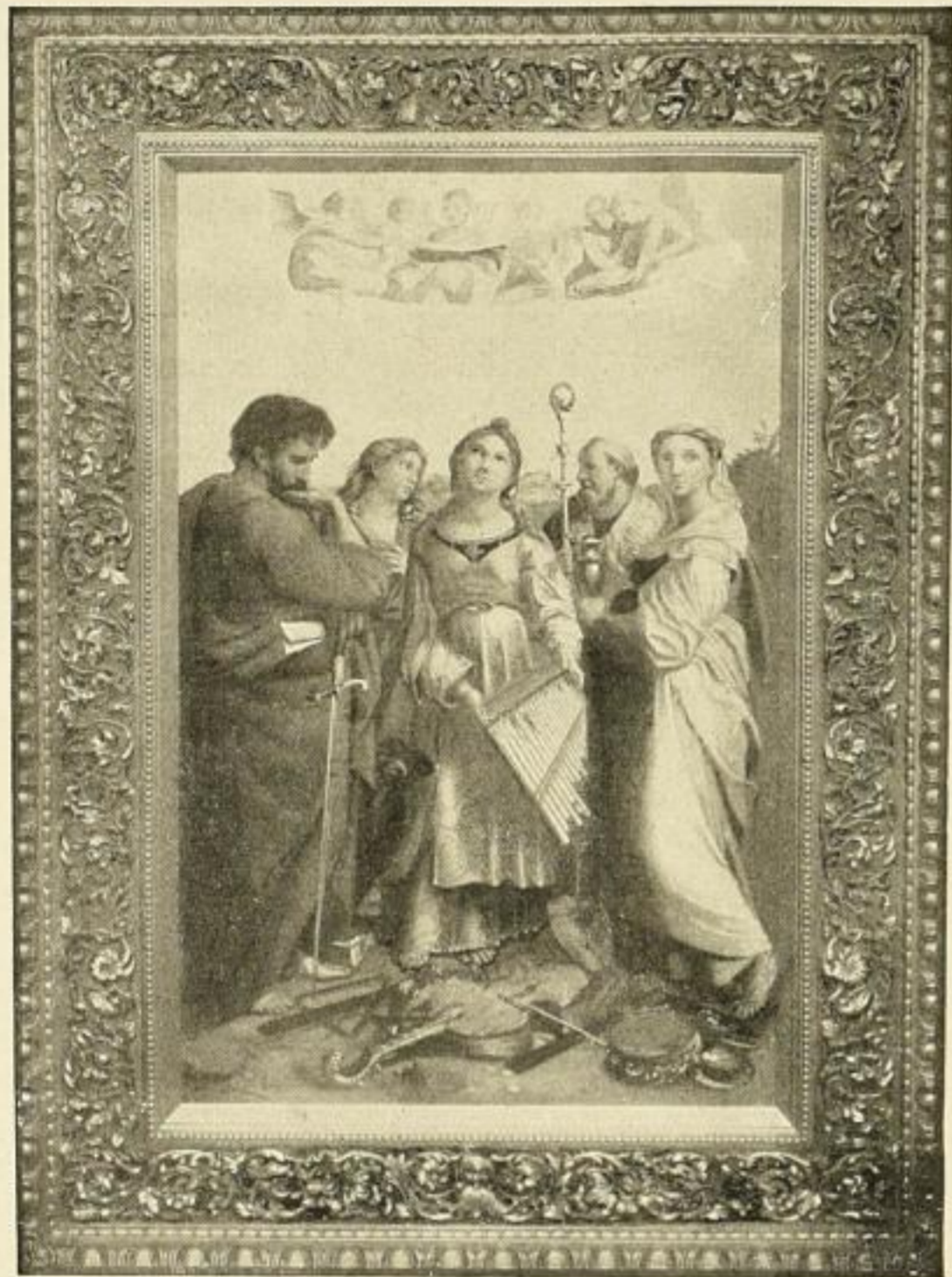
Nr. 4. RAFAEL: Heil. Caecilie. Bild 64×100 cm . . . . . M. 55.— (Der obige Rahmen ist während des Krieges nicht lieferbar.) Im reichverzierten Gold-Renaissance- rahmen 85×121 cm . . . . . M. 225.—

Nach dem Original im Palazzo Pitti in Florenz.