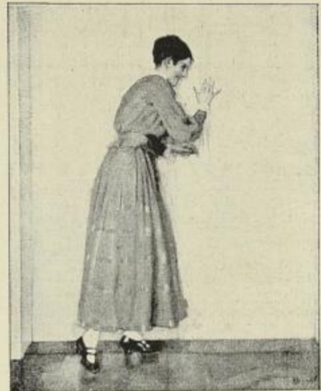
Er schläft noch

Farbenprächtige Bilder nach besonders reizvollen Originalen des beliebten Künstlers Papiergrösse 42×31 cm