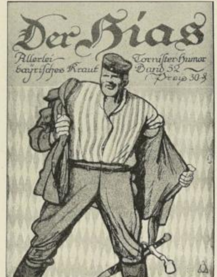
Band 52: Der Hias

Lustige Fahrten vom Felde zur Heimat Ausgeführt von Max Jacius