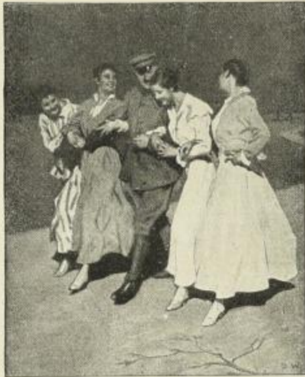
Der Hahn im Korb