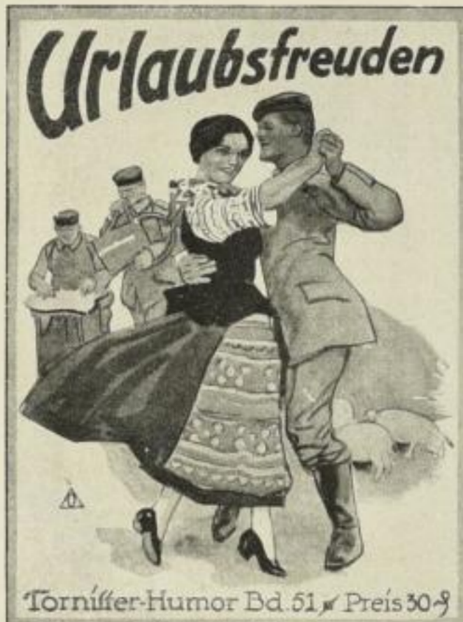
Band 51: Urlaubsfreuden

Lustige Fahrten vom Felde zur Heimat Ausgeführt von Max Jacius