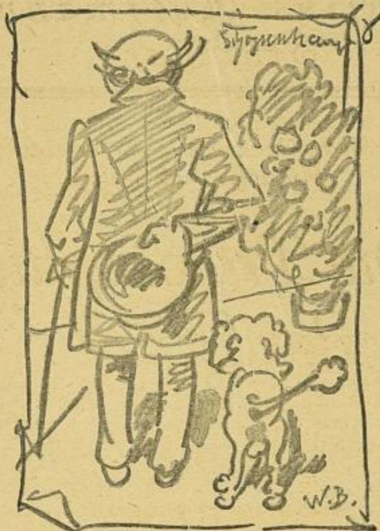
Schopenhauer mit seinem Pudel

Auf den Weihnachtstisch seiner zahlreichen Verehrer gehört: