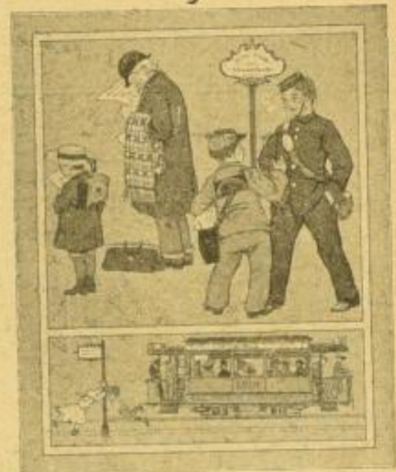
6. Die Straßenbahn

Was kommt dort mit Gebräus heran? Klingling — bimbin! Die Straßenbahn! Der Schaffner steht schon auf dem Tritt. Schnell eingestiegen | Wer will mit?