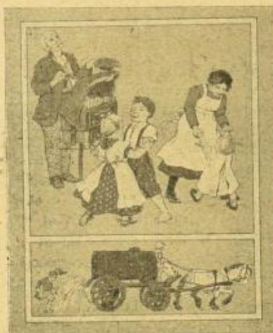
5. Der Leiermann