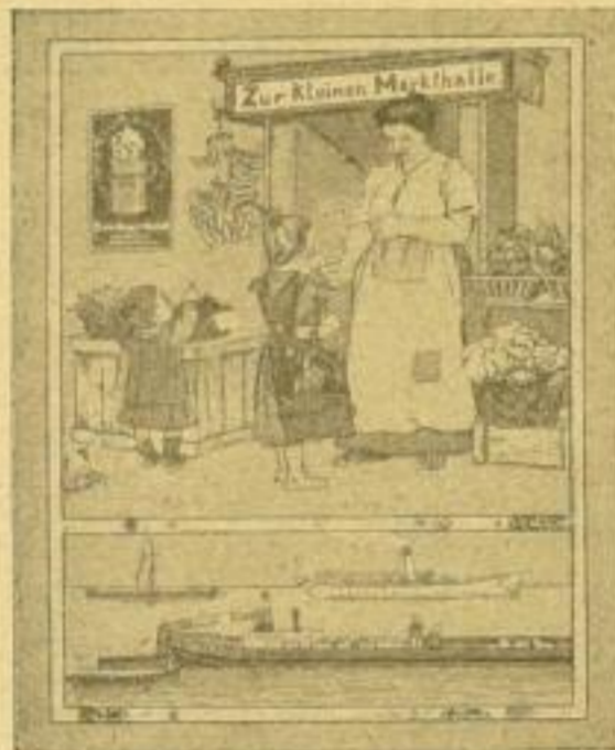
3. Der Einkauf