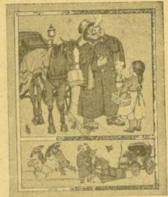
8. Nach der Arbeit

Die kleinen Bildwiedergaben mögen eine Vorstellung von Inhalt, Stimmung und Rhythmus erwecken, durch die dieses Buch ausgezeichnet ist.