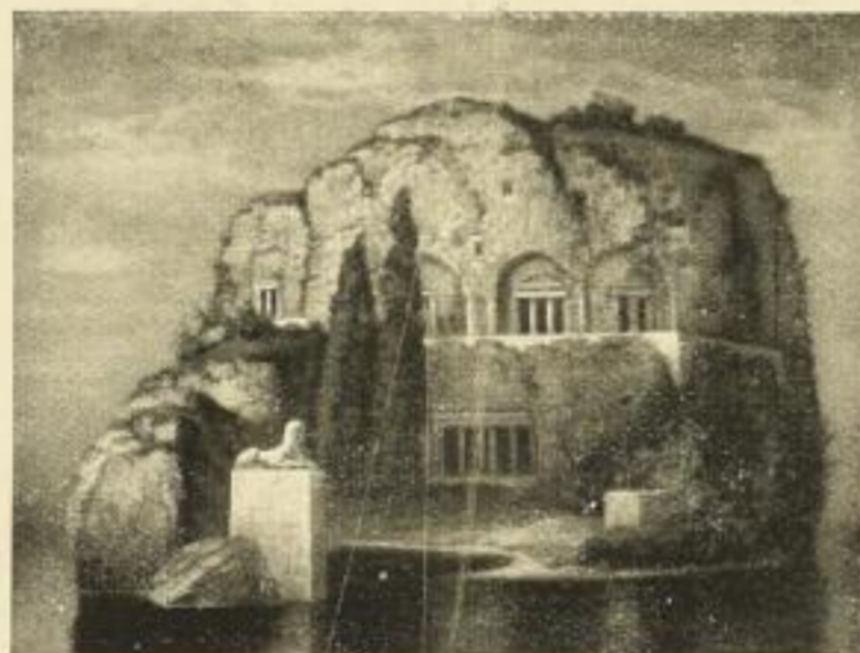
Hermann Rüdisühli, Heilige Stätte. Handkupferdruck Bildgrösse: 45 x 58 cm. Preis 36 Mark