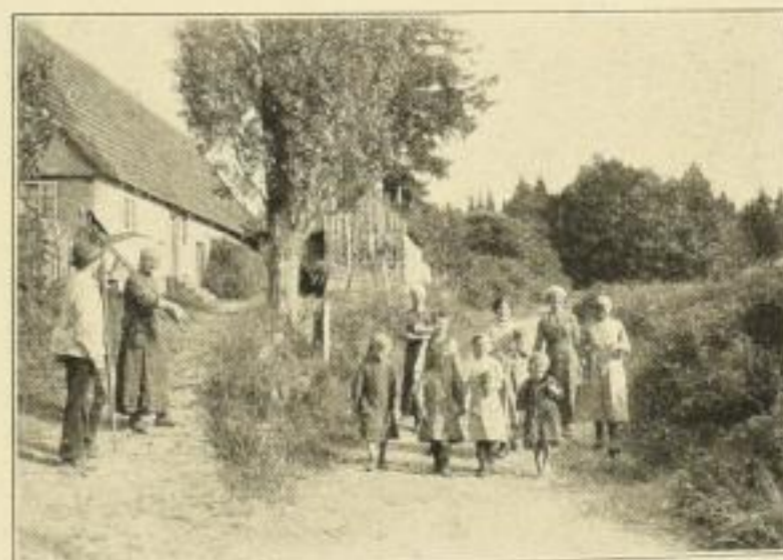
P. Hommel, Fröhliche Heimkehr. Künstl. Vierfarbendruck 21 x 29 cm. Preis 4 Mark

Die mit * bezeichneten Kunstblätter befinden sich in Vorbereitung und erscheinen in Kürze.