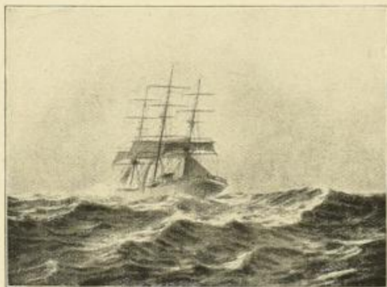
R. Schmidt, In schwerem Wetter. Künstl. Vierfarbendruck Bildgrösse: 20 x 29 cm. Preis 4 Mark