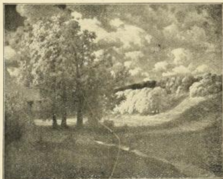
Hermann Rüdisühli, Wiesengrund. Künstl. Vierfarbendruck Bildgrösse: 31 x 45 cm. Preis 8 Mark