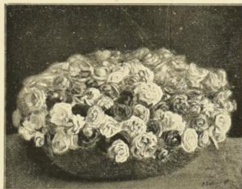
* C. F. Lederer, Rosen. Farbenlichtdruck Bildgrösse: 63 x 84 cm. Preis 40 Mark