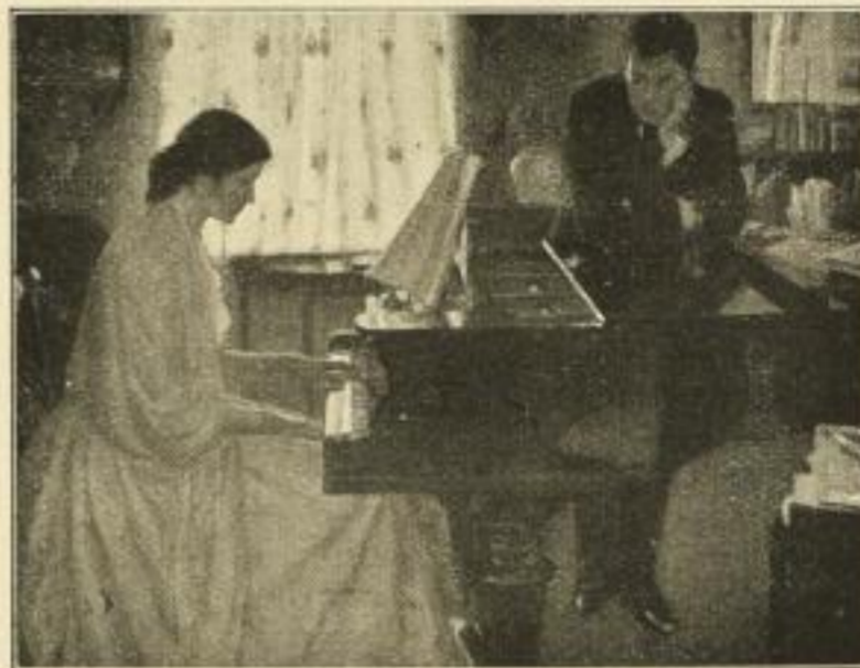
Ernst Oppler, Präludium. Farbenlichtdruck Bildgrösse: 48 x 63 cm. Preis 40 Mark Künstl. Vierfarbendruck. Bildgrösse: 22 x 29 cm. 4 Mark